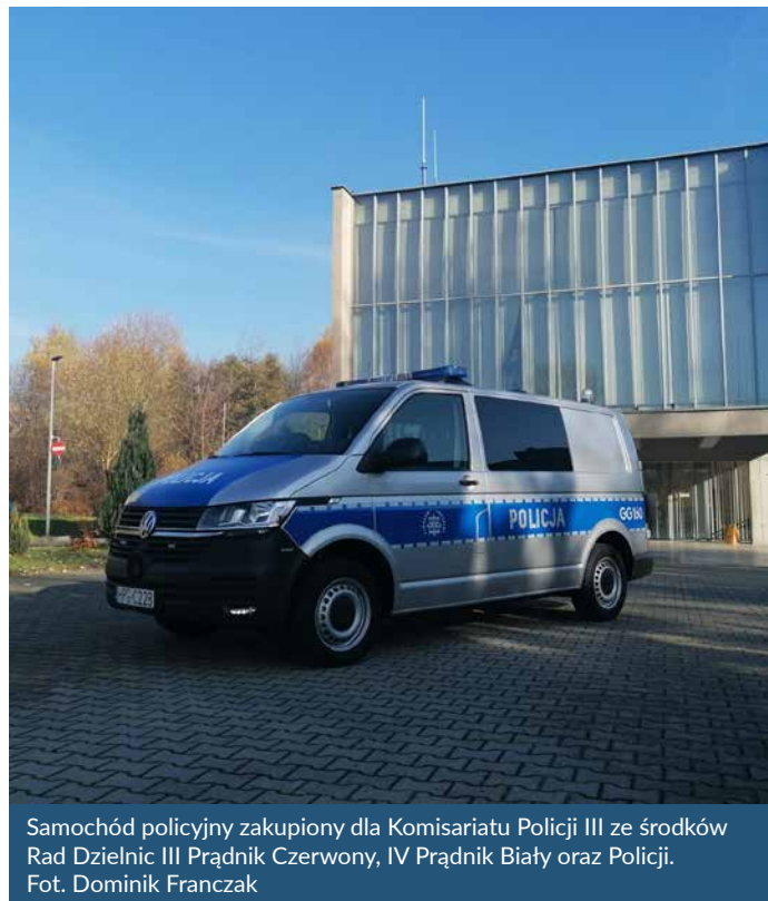
Samochód policyjny zakupiony dla Komisarjatu Policji III ze środków Rad Dzielnic III Prądnik Czerwony, IV Prądnik Biały oraz Policji.

Innym razem do policjantów wpłynęło zgłoszenie telefoniczne, że nieznaną mężczyznę dokonał – zgodnie z nomenklaturą policyjną – „naruszenia czynności narządu ciała” drugiego mężczyzny poprzez przecięcie ostrym narzędziem skóry na torsie. Pokrzywdzony nie chciał współpracować z Policją. Został zabrany przez pogotowie ratunkowe w stanie nie zagrażającym jego życiu. Na miejscu policjanci dokonali zabezpieczenia monitoringu z wizerunkiem sprawcy zdarzenia, a także dokonali penetracji drogi jego odejścia. Po kilku godzinach wpłynęło zgłoszenie o agresywnym zachowaniu się nieznanego mężczyzny w pobliżu poprzedniego miejsca zdarzenia. Przeglądając monitoring na miejscu zdarzenia stwierdzono, że zarejestrowany wizerunek mężczyzny odpowiada wizerunkowi legitymowanego dnia poprzedniego. Ustalono jego dane personalne. W tym samym czasie wpłynęło kolejne zgłoszenie o agresywnym mężczyźnie. Od razu rozpoznano w nim sprawcę uszkodzenia ciała sprzed kilku godzin