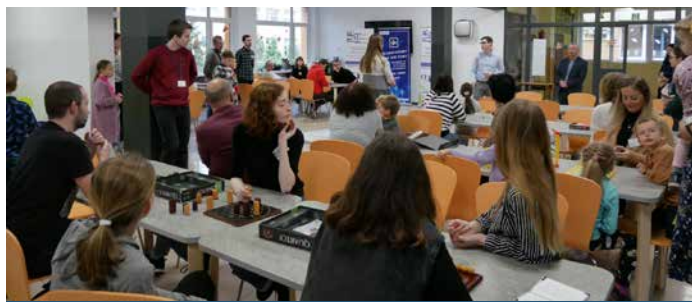
Festiwal Gier Logicznych.