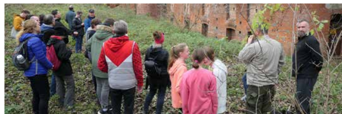
Uczestnicy wycieczki przy forcie pancernym pomocniczym 45a „Bibice”.