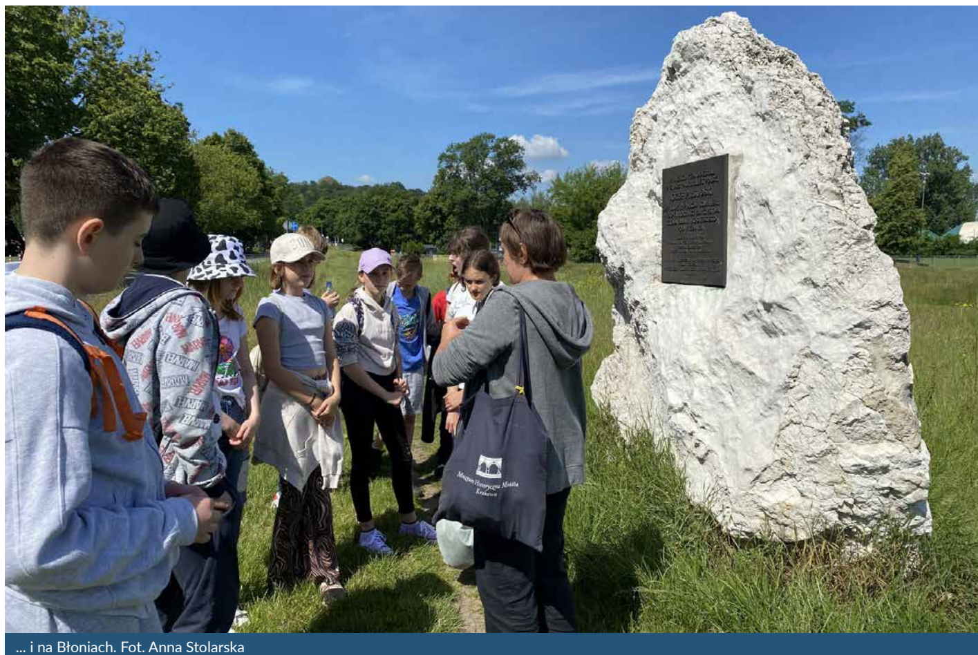
... i na Błoniach.