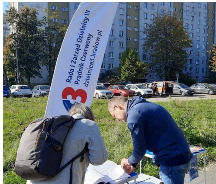
Mobilny punkt do głosowania Rady Dzielnicy III pozwala promować ideę Budżetu Obywatelskiego Miasta Krakowa w różnych punktach do głosowania i jednocześnie daje możliwość oddania głosu przez zainteresowanych mieszkańców.

jak plac zabaw przy ul. Ślicznej/ Janusza Meissnera, ul. Seniorów Lotnictwa oraz w parkach Zaczarowanej Dorożki i Reduta udało nam się zebrać do urny około 300 głosów, a wiele osób zachęciliśmy do zagłosowania z domu za pomocą Internetu. Wybór nie był łatwy, bo w tym roku Dzielnica III przodowała w Krakowie pod względem projektów, które poddano głosowaniu (więcej na ten temat pisał Mateusz Drożdż w poprzednim numerze „Biuletynu”, który dostępny jest na naszej stronie, a skrót znajduje się na str. 9 obecnego numeru).