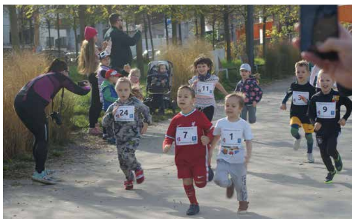
Uczestnicy I Czerwonoprądnickiego Biegu Przedszkolaka.

Wychodząc naprzeciw potrzebom najmłodszych mieszkańców w sobotę 29 października 2022 r. Rada Dzielnicy III Prądnik Czerwony zorganizowała I Czerwonoprądnicki Bieg Przedszkolaka. Do udziału w zawodach zaproszono wszystkie przedszkola samorządowe znajdujące się na terenie Dzielnicy III. Klasyfikacja opierała się na liczności dzieci z danej placówki – im więcej dzieci, tym wyższa lokata. Taka formuła rywalizacji miała zapewnić aktywizację