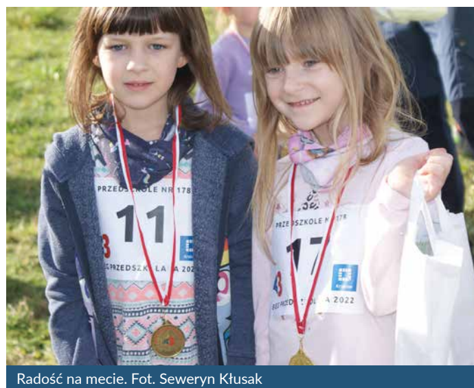
Radość na mecie.

W klasyfikacji przedszkoli pierwsze miejsce oraz nagrodę finansową w kwocie 3 000 zł wywalczyło Przedszkole Samorządowe nr 178, które na starcie zgromadziło aż 39 swoich wychowanków. Na miejscu drugim, zdobywając czek o wartości 2 000 zł, uplasowało się Przedszkole nr 162, miejsce trzecie i bonus wysokości 1 000 zł przypadły w udziale Przedszkolu nr 122. Nagrody przeznaczone zostały na zakup pomocy edukacyjnych i sprzętu sportowego.