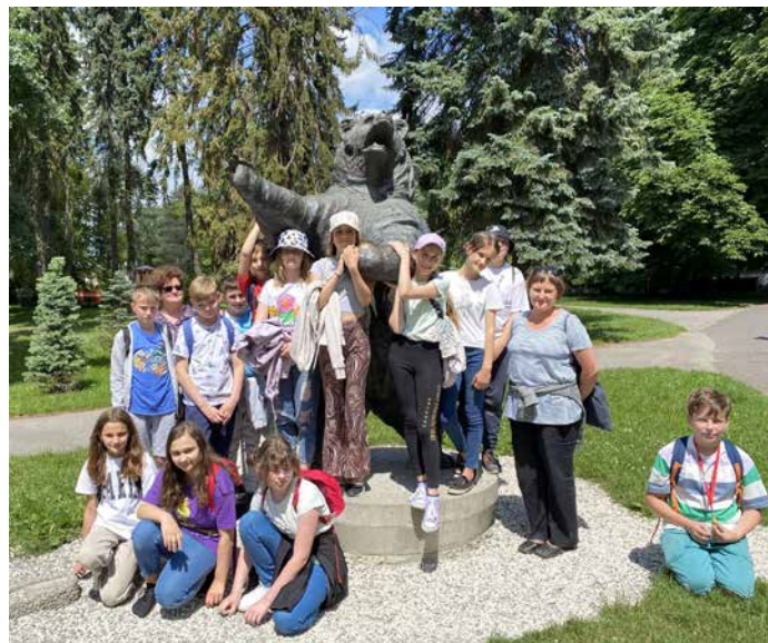
Uczestnicy programu „Eksploracja Krakowskiej Historii” przy pomniku Niedźwiedzia Wojtka z 2. Korpusu Polskiego w Parku im. dr. Henryka Jordana.

Klasa Va natomiast wybrała się na spacer – przez łąkę do parku. Uczniowie wzięli udział w zajęciach zorganizowanych przez Dom Zwierzyniecki, podczas których poznali historię, wartość i niezwykłość największej w Europie łąki w środku miasta – Błonia krakowskich. Dowiedzieli się, skąd wzięły się w krajobrazie miasta, jak się zmieniały, jakie wydarzenia, ważne dla Krakowa, tam właśnie miały miejsce. Przy okazji sami doświadczyli uroku naszej zwierzynieckiej łąki. Spacer zakończył się w Parku im. Henryka Jordana, gdzie uczniowie poznawali życiorysy znanych Polaków, tropiąc ich parkowe ślady.