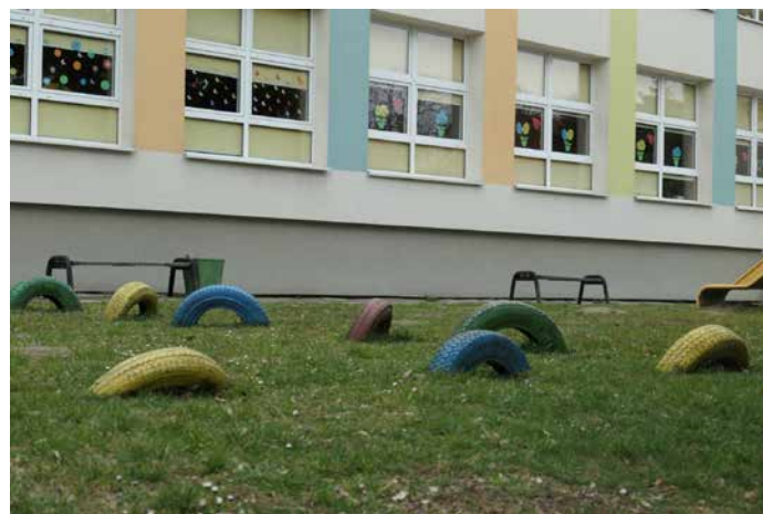
Remonty budynków i otoczenia szkół i przedszkoli to jedna z najważniejszych pozycji w budżecie Rady Dzielnicy III.

Udało się zakupić książki dla Biblioteki Kraków – do wszystkich siedmiu filii: przy ul. Dobrego Pasterza 6, al. 29 Listopada 59, ul. Bosaków 11, ul. Łąkowej 27, ul. Mirosława Dzielskiego 2, ul. Ugorek 14 i ul. Dobrego Pasterza 100 – oraz do wszystkich bibliotek szkolnych