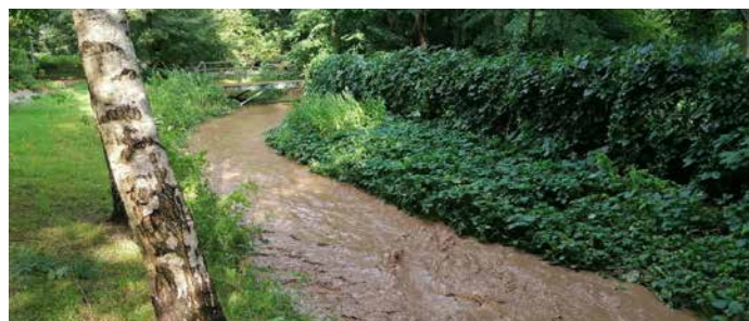
Wzburzony po ulewnych deszczach potok Sudół Dominikański (Rozrywka) płynący obok parku Ogród nad Sudółem w rejonie ul. Naczelnej w kierunku przepustu pod ul. Dobrego Pasterza.

Obecny stan faktyczny jest skrajnym zagrożeniem dla mieszkańców. Nikt nie może spokojnie spać, mając świadomość zagrożenia wynikającego z gwałtownych opadów deszczu, który może wydarzyć się przecież niemal w każdej chwili. Jedynym, co w tej sytuacji może umiarkowanie cieszyć, jest świadomość zagrożenia deklarowana zarówno przez Wody Polskie, jak i Magistrat. Jednak głęboki niepokój budzi opieszałość w podejmowaniu decyzji mających zagrożenie to zniwelować.