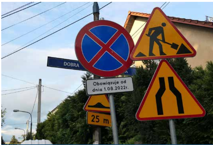
Ul. Mieszka I to jeden z przykładów remontów drogowych w Dzielnicy III.

tury drogowej. Udało się przeprowadzić modernizację ul. Mieszka I oraz ul. Swojskiej. Ponadto zmodernizowaliśmy kilka chodników między innymi przy ul. Tadeusza Kantora, na psim wybiegu przy ul. Strzelców, czy chodnik pomiędzy ul. Dobrego Pasterza a Strzelców. Wykonany został również chodnik wraz z kładką pomiędzy ul. XX Pijarów a terenem Spółdzielni Mieszkaniowej „Ugorek” oraz przygotowano miejsca pod stojaki rowerowe przy ul. Bohaterów Wietnamu i wytyczono je przy ul. Tadeusza Kantora. Udało się doświetlić newralgiczne punkty, takie jak rejon ulic: Młyńskiej, Pilotów i Sadzawki czy dojście do Muzeum Lotnictwa Polskiego od strony ul. Seniorów Lotnictwa. Dodatkowo udało się pozyskać dokumentację na budowę oświetlenia przy ul. Szkółkowej i modernizację niedziałającego oświetlenia placu zabaw przy ul. Kazimierza Chałupnika.