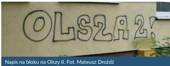
Napis na bloku na Olszy II.

Mateusz Drożdż Członek Zarządu Dzielnicy III Prądnik Czerwony