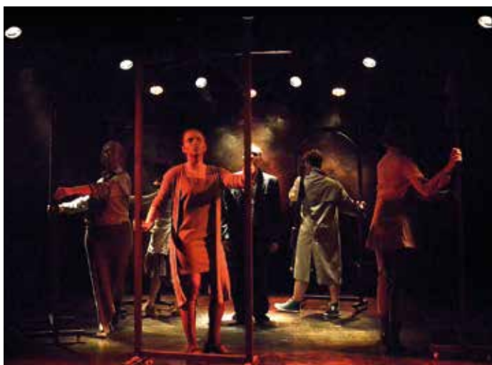
„Król umiera” na podstawie dramatu Eugne Ionesco (Teatr Między Wierszami).

Od 30 lat prowadzi amatorskie zespoły teatralne, laureat licznych nagród i wyróżnień na przeglądach i festiwalach wojewódzkich i ogólnopolskich