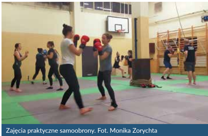
Zajęcia praktyczne samoobrony.

Członkini Rady Dzielnicy III Prądnik Czerwony