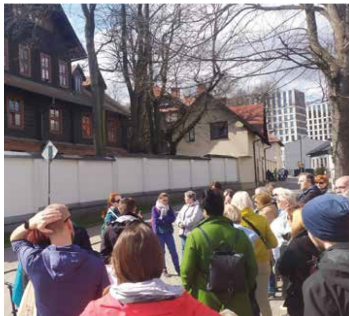
Uczestnicy wycieczki przy sanktuarium Ecce Homo przy ul. Jana Pawła Woronicza.