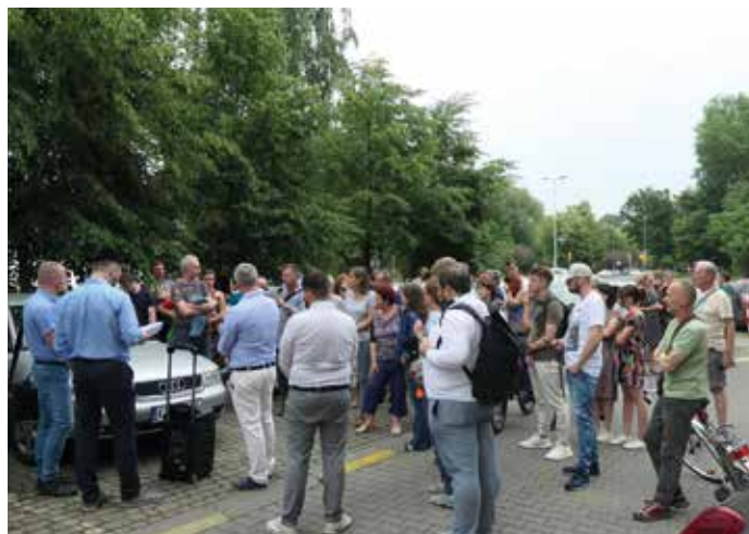
Spotkanie mieszkańców z projektantami w terenie po serii spotkań on-line.

Co dalej? Zobaczmy. Zgodnie z obietnicą Wiceprezydenta Andrzeja Kuliga zostało zorganizowane spotkanie podsumowujące w terenie. Wiemy też, że uda się ocalić