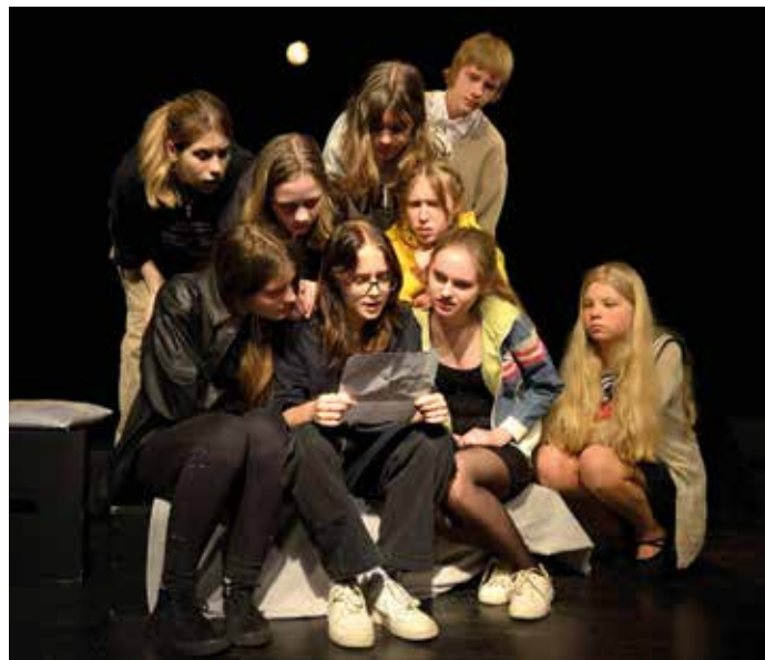
„Konkurs” na motywach „Rewizora” Mikołaja Gogola (Grupa Warsztatowa Sceny 5na3 Junior).

A teraz zejdźmy trochę głębiej. By móc podjąć dialog z widzem, młody człowiek musi zacząć od rozmowy w zespole. W zespole jest intymniej. Można mówić otwarcie,