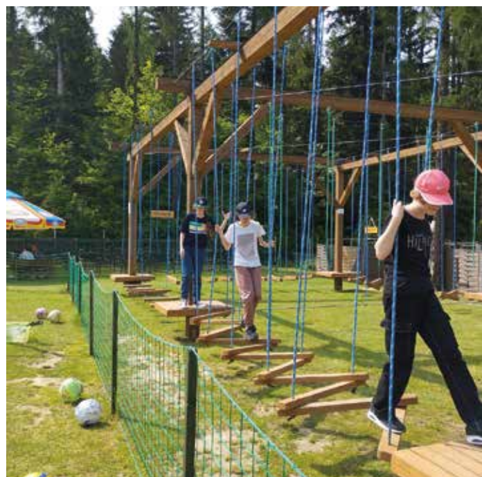
Zielona szkoła klasy 6c ze Szkoły Podstawowej nr 95.

Inicjatywa „Złap oddech w górach 2023” przygotowana została dzięki środkom pochodzącym m.in. z mojej poprawki do budżetu miasta Krakowa. Kwota w wysokości 1 800 000 zł umożliwia ponad 4 000 dzieci wyjazd na zielone szkoły. Łącznie odbędą się 22 turnusy do dwóch miejskich ośrodków wypoczynkowych.