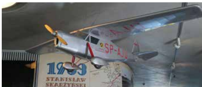
Fragment wystawy „1933. Stanisław Skarżyński – zdobywca Atlantyku” w Muzeum Lotnictwa Polskiego.

Członek Zarządu Dzielnicy III Prądnik Czerwony