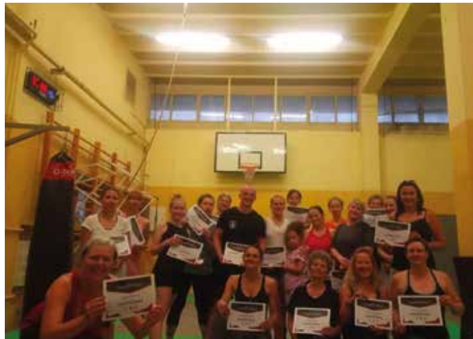
Uczestniczki kursu samoobrony wraz z instruktorem.

Zesłoroczne edycje kursów samoobrony dla kobiet stały się również elementem szerszych badań, w których uczestnicy pytani byli m.in. o dotychczasowe doświadczenia związane z bezpieczeństwem osobistym, ocenę bezpieczeństwa w Krakowie oraz służb za nie odpowiedzialnych. Ich wyniki pozwoliły na lepsze dostosowanie programu kursu do potrzeb oraz potwierdziły, że udział w szkoleniu z samoobrony pozytywnie wpływa na poczucie bezpie-