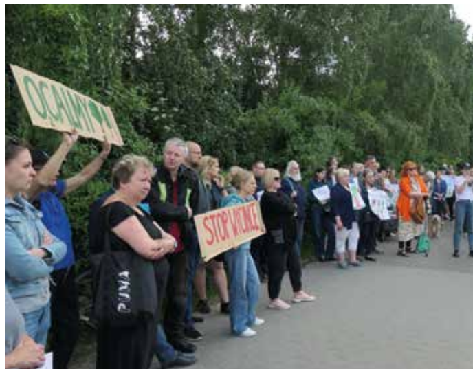
Protest mieszkańców przy ul. Młyńskiej.

W efekcie działań protestacyjnych 31 maja odbyła się sesja Rada Miasta Krakowa, na której jednym z punktów obrad była trwająca prawie pięć godzin informacja Prezydenta Miasta Krakowa oraz trwająca po niej dyskusja dotycząca budowy tramwaju Meissnera-Mistrzejowice. Na sesji była obecna również prawie 100-osobowa grupa mieszkańców, którzy w ten sposób chcieli zaprotestować przeciwko nadmiernej wycince. Wg zapewnień Prezydenta miał być wznowiony dialog na linii Urząd – mieszkańcy, a w radach budowy mają być uwzględnieni również przedstawiciele mieszkańców.