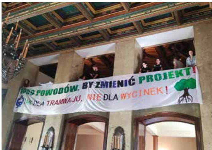
Mieszkańcy w trakcie sesji Rady Miasta Krakowa w środę 31 maja 2023 r.

Zdajemy sobie sprawę, że sporo drzew zostało zakwalifikowanych do przesadzenia, ale nie zmienia to faktu, że jeszcze sporo kolejnych młodych zdrowych drzew można uratować. Jako Rada Dzielnicy wielokrotnie interweniowaliśmy w sprawie ograniczenia wycinki zieleni – przez ostatnie 2,5 roku podjęliśmy w tej sprawie 17 uchwał Rady i 1 uchwałę Zarządu! – i wydawało się, że wszystko jest na dobrej drodze. Większość ekranów akustycznych, które też spotkały się ze sprzeciwem mieszkańców, została usunięta z projektu, a wycinka drzew miała być ograniczona. Niestety, ilość drzew, która została zakwalifikowana do wycięcia, jest nadal nieakceptowalna.