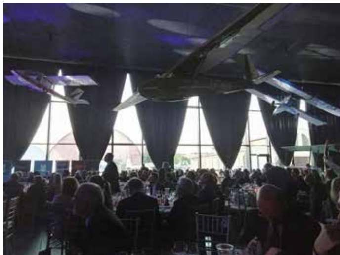
Uczestnicy Gali Jubileuszowej 60-lecia Muzeum Lotnictwa Polskiego.

Muzealnicy nie mieli łatwo. Po pierwszych sukcesach wystawienniczych w latach 60., nastąpiły trudne dla Muzeum lata 70. i 80. Choć zbiory powiększały się, to rozbudowująca się Politechnika Krakowska zredukowała teren muzealny o ponad połowę. We wschodniej części – w Czyżynach – powstały osiedla mieszkaniowe, natomiast część zachodnia – Rakowice – niszczała jako wysypisko ziemi bu-