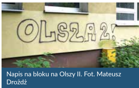
Napis na bloku na Olszy II.

Powstaje książka poświęcona Olszy II. Na razie jej twórcy zbierają materiały archiwalne, zdjęcia oraz wspomnienia mieszkańców, w pierwszym etapie skupiając się na kontakcie z osobami pamiętającymi początki tego osiedla.