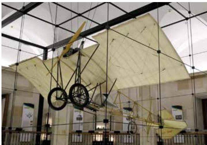
Replika samolotu brazylijskiego pioniera lotnictwa Santos-Dumonta Demoiselle z 1906 r. w Narodowym Muzeum Techniki w Warszawie.