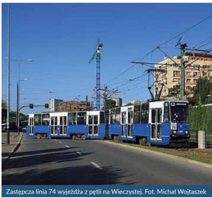
Zastępcza linia 74 wyjeżdża z pętli na Wieczystej.

Niestety w ostatnim czasie funkcjonowanie linii 139 wiązało się z wieloma problemami, na co wpływały jej długość, bardzo duży ruch pojazdów na krakowskich ulicach, liczne korki na trasie przejazdu oraz szereg inwestycji komunikacyjnych prowadzonych w północnych rejonach miasta. Przez to autobusy kursowały na niej bardzo niepunktualnie, przyjeżdżały po 2 lub nawet 3 naraz na przystanek, a opóźnienia poszczególnych kursów wynosiły średnio ok. 1 godz., a nawet sięgały 3 godz. Powodowało to bardzo liczne skargi mieszkańców naszej Dzielnicy. Rada Dzielnicy III Prądnik Czerwony we wrześniu 2022 r. podjęła uchwałę wnioskującą do Prezydenta Miasta Krakowa i Zarządu Transportu Publicznego o wprowadzenie zmian, które wpłyną na poprawę kursowania linii 139 poprzez wprowadzenie alternatywnego rozwiązania wspomagającego obsługę jej trasy, pozwalającą na omijanie najbardziej zakorkowanych miejsc, bądź jej przeorganizowanie.