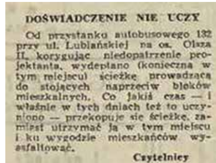
List do redakcji „Dziennika Polskiego”, opublikowany 5 września 1968 r., ze skargą czytelników na brak chodników na Olszy II.

przedszkoli? Czy na Olszy były jakieś punkty gastronomiczne, co tam można było zjeść? Jak wyglądało życie sąsiedzkie? Czy sąsiedzi zapraszali się nawzajem do mieszkań? Jak dorośli spędzali czas po pracy? Czy były jakieś czyny społeczne? Na czym one polegały? Kto je organizował? Czy wielu sąsiadów miało samochody? Czy były jakieś niecodzienne wydarzenia godne zapamiętania? Może im-