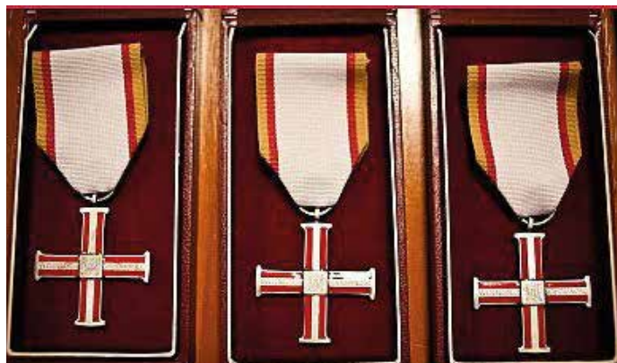
Krzyż Wolności i Solidarności.