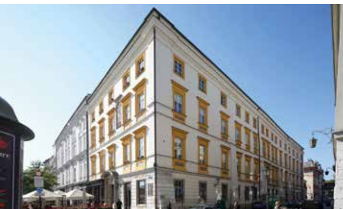
Pałac Krzysztofory.

Dzięki współpracy z Radą Dzielnicy III Prądnika Czerwonego uczniowie z placówek szkolnych z terenu Prądnika Czerwonego, Rakowic i Olszy korzystają z bezpłatnych zajęć muzealnych w Muzeum Krakowa. Największą popularnością wśród młodszych odbiorców cieszą się warsztaty o legendach krakowskich i szopkach krakowskich. W ofercie są też warsztaty dla starszych uczniów o lokacji średniowiecznego miasta, W rycerskiej i miejskiej zbrojowni, czy też Kraków – przystanek niepodległość, podczas tych ostatnich prezentowany jest udział Krakowa w odrodzeniu państwa polskiego w 1918 r. W sprawie bezpłatnych zajęć prosimy o kontakt z biurem Oddziału Pałac Krzysztofory, tel. 12 61 92 335, mail: krzysztofory@muzeumkrakowa.pl