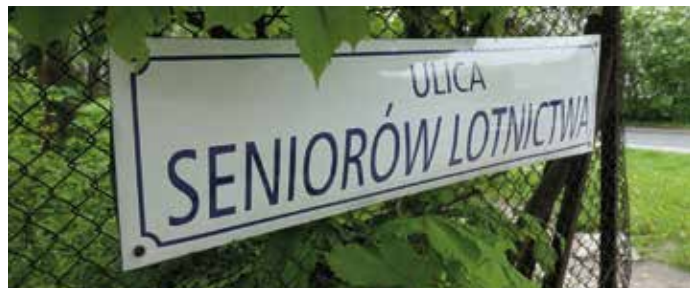
Ulica Seniorów Lotnictwa wiodąca od osiedli Ugorek i Wieczysta do Muzeum Lotnictwa Polskiego upamiętnia tych, którzy polskie lotnictwo tworzyli, a następnie dbali i dbają o godną pamięć o nim.

O muzeum lotniczym rozmawiano w Polsce już od lat międzywojennych. I choć trudno było mówić o zabytkach, skoro eksponaty miały ledwie kilkanaście lat, to głównym problemem było jednak to, w jaki sposób pokazać samoloty. Próbowano je eksponować jako zagadnienie techniczne w Muzeum Przemysłu i Techniki w Warszawie, a po wojnie w Muzeum Techniki w Warszawie. Próbowano jako zagadnienie wojskowe – przed wojną w Poznaniu i po wojnie w Muzeum Wojska Polskiego w Warszawie. Próbowano jako narzędzia komunikacji do czego się przymierzano już przed wojną, a nie udało się mimo prób już po wojnie, czy jako sportu, choć dziwnym trafem nie znalazło się miejsce na sporty lotnicze w powojennym Muzeum Sportu, a także jako polski wkład w rozwój światowego lotnictwa – z polskimi pionierami oraz ze zwycięzcami Challenge'u 1932 r.