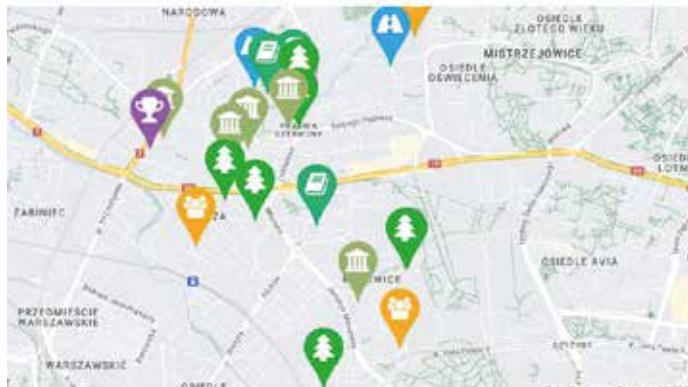
Mapa, na której pokazano część projektów zgłoszonych przez mieszkańców Dzielnicy III. Wszystkich projektów dzielnicowych jest 35.

Zapraszamy też Państwa do punktów do głosowania, które zostały zorganizowane przez Radę Dzielnicy III Prądnik Czerwony: