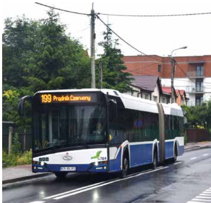
Nowa linia 199 na ul. Dobrego Pasterza.

Linia autobusowa 139 wozi krakowian od 1979 r. Początkowo jej trasa wiodła z Centrum Administracyjnego Huty (Kombinatu) do Cichego Kącika, a od 1983 r. skierowano ją do Bronowic. W latach 1996-2005 oraz 2012-2016 kursowała też wspomagająca ją linia 439. W 2011 r. linię 139 wydłużono do Mydlnik, a w 2021 r. do przystanku kolejowego i parkingu P+R Mydlniki Wapiennik. Jej licząca 22,3 km trasa ze zlokalizowanymi na niej 47 przystankami, której przejazd rozkładowy zajmował 63 min., łącząca wschodnią i zachodnią część miasta sprawiała, że była to najdłuższa dzienna linia autobusowa o charakterze magistralnym, przewożąca najwięcej pasażerów w ciągu doby. Jej popularność spowodowała, że w ostatnich latach w godzinach szczytu kursowała z częstotliwością od 7,5 do 10 minut.