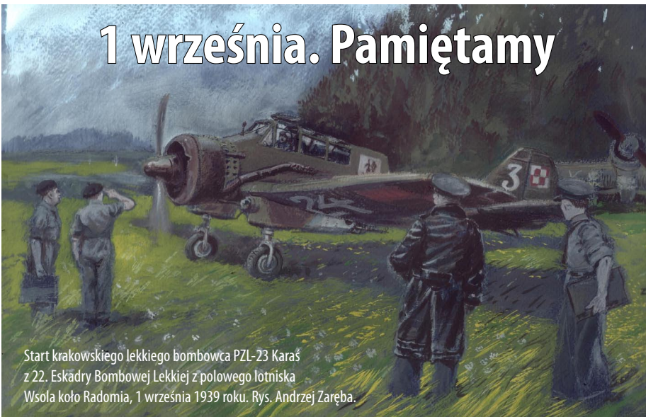
Start krakowskiego lekkiego bombowca PZL-23 Karaś z 22. Eskadry Bombowej Lekkiej z połowego lotniska Wsola koło Radomia, 1 września 1939 roku. Rys. Andrzej Zaręba.

Rankiem 1 września 1939 roku niemieckie bomby spadły na lotnisko w Rakowicach. Spłonął budynek kompanijnych koszar lotniczych, uszkodzone zostały hangary, a na lotnisku zostało zniszczonych kilkadziesiąt samolotów. Nie ucierpiała jednak żadna maszyna bojowa – te przeniesiono tuż przed wybuchem wojny na lotniska polowe. Myśliwskie PZL P.7a i PZL P.11c ze 121., 122. i 123. Eskadry Myśliwskiej, bombowe i rozpoznawcze PZL-23 „Karaś” z 21. i 22. Eskadry Bombowej Lekkiej oraz 24. Eskadry Rozpoznawczej, obserwacyjno-łącznikowe RWD-14 „Czapla” i Lubliny R. XIII d z 23. i 26. Eskadry Obserwacyjnej z krakowskiego 2. Pułku Lotniczego wykorzystano do walki z najeźdźcą.