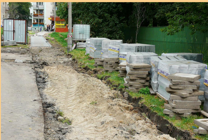
Ul. Nieduża – remont chodników.