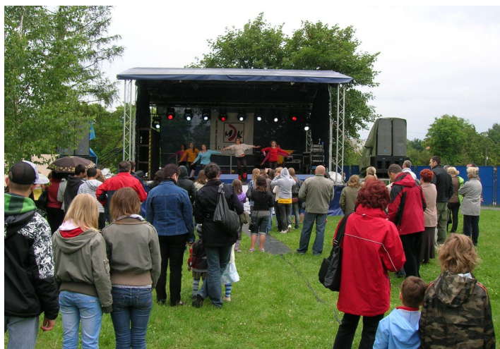
Występy artystyczne na scenie.

Rafał Miś Radny Dzielnicy III – Prądnik Czerwony rafal.mis@gazeta.pl