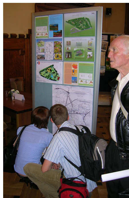
Mieszkańcy oglądali naszą tablicę informacyjną.