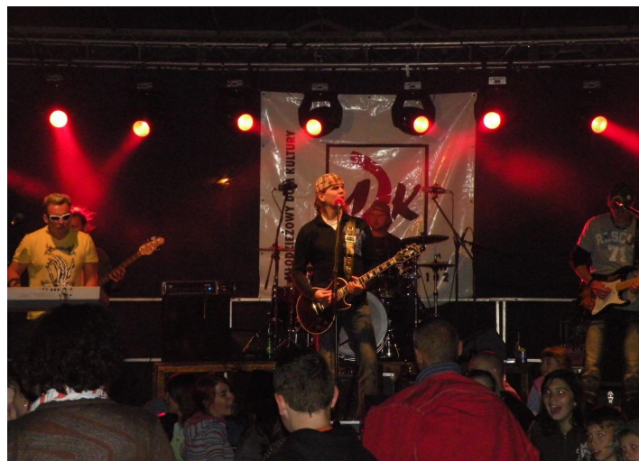
Wieczorny koncert Detoxu.