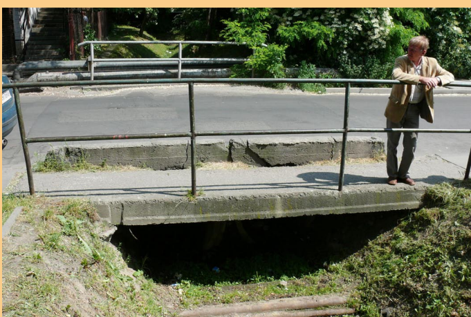
Mostek na ul. Młyńskiej Bocznej przed remontem i po remoncie.