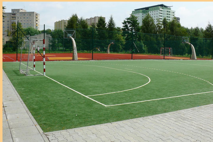
Ogólnodostępne boiska sportowe Szkoły Podstawowej nr 2 – w pobliżu kończy się właśnie budowa Skatoparku.