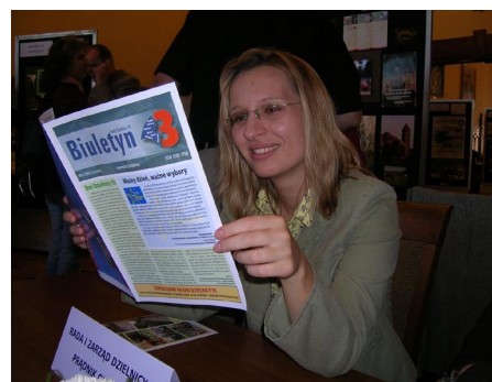
Nasz „Biuletyn” cieszył się zainteresowaniem.

Ponadto odwiedzający w tym dniu krakowski magistrat mogli zwiedzić gabinety Prezydenta