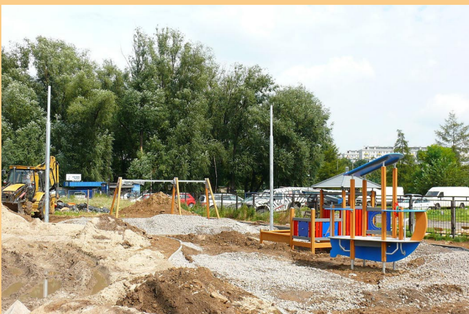
Budowa placu zabaw przy ul. Chałupnika.