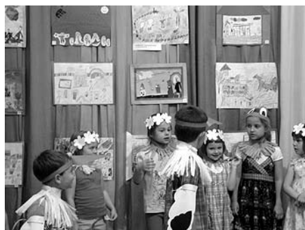
Wystawa prac konkursowych w Przedszkolu nr 12.

– Na pewno tym, że jest przyjazne dla dzieci. Musi zaspokoić podstawową potrzebę dzieci