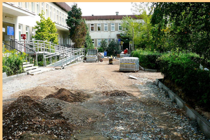
Ul. Strzelców – remont chodników wokół przychodni zdrowia.