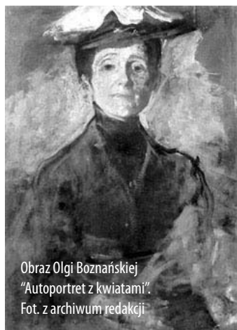
Obraz Olgi Boznańskiej „Autoportret z kwiatami”.