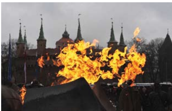
Uroczystości przed Grobem Nieznanego Żołnierza.

11 listopada to data odzyskania niepodległości przez Polskę. Wraz z końcem 4-letniej Wielkiej Wojny w 1918 roku zakończył się 123-letni okres zaborów i niebytu naszego kraju na mapach Europy. 11 listopada 1918 roku w Warszawie przekazano Józefowi Piłsudskiemu pełnię władzy w kraju, który jeszcze nie miał ustalonych granic i nie był pewien odzyskanej wolności. Święto Niepodległości uchwalono w 1937 roku na pamiątkę tego wydarzenia. Uroczystości jednak zdążyło zorganizować jedynie dwukrotnie – wkrótce wybuchła II Wojna Światowa. Święto obchodzono na emigracji, a tradycję w kraju podtrzymywało Radio Wolna Europa, Kościół i środowiska niepodległościowe. Święto zostało przywrócone uchwałą sejmową w lutym 1989 roku.