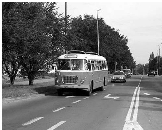
„Ogórek” na ul. Strzelców.