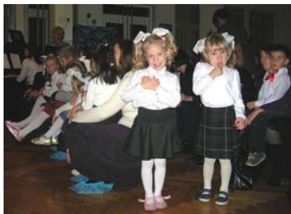
Przedszkolaki i ich rodzice w trakcie uroczystości w Przedszkolu nr 12.

Tradycja ma jednak szansę, aby odrodzić się, ponieważ wiele krakowskich placówek szkolnych zorganizowało z tej okazji uroczystości okolicznościowe. Jedne z nich miały miejsce w naszym Przedszkolu nr 12. W udekorowanej biało-czerwonymi barwami sali gimnastycznej grupy przedszkolaków przed-