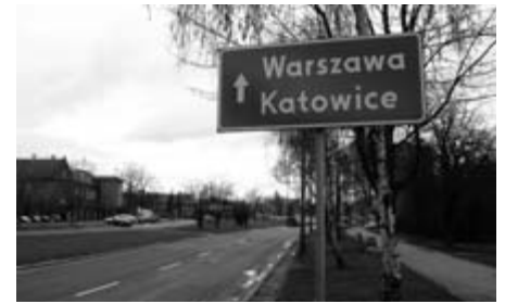
Tablica dla kierujących się na Kielce i Warszawę przez ul. Meissnera i Młyńską. Ukryta groźba przed zbyt dogodnym skrótem na linii ul. Nowohucka – al. 29 Listopada.