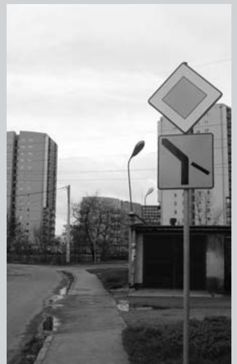
Znak przy ulicy Kantora ustanawiający pierwszeństwo przejazdu na skrzyżowaniu z ulicą Ostatnią.

Mateusz Drożdż Radny Dzielnicy III Prądnik Czerwony e-mail: mateusz.drozd@onet.pl