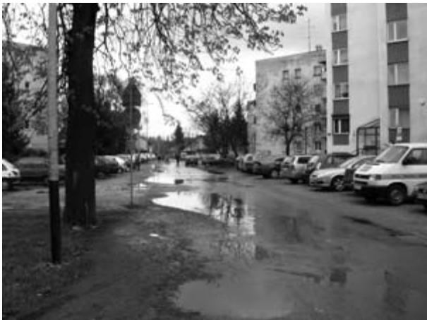
Trudniejszy fragment do wyremontowania ul. Gdańskiej, który będzie wymagał pomocy tzw. specustawy drogowej.