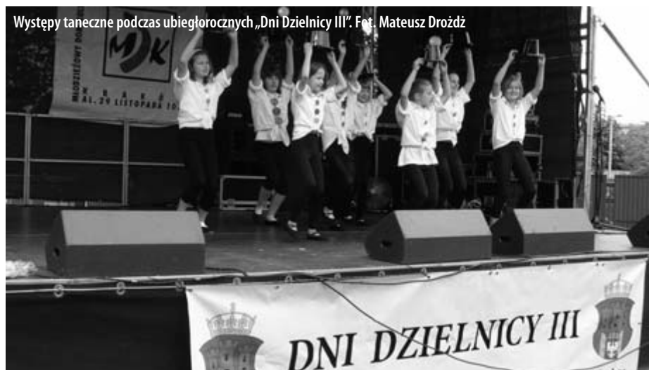
Występy taneczne podczas ubiegłorocznych „Dni Dzielnicy III”.

Przewodniczący Komisji Infrastruktury Komunalnej i Budownictwa Rady Dzielnicy III Prądnik Czerwony