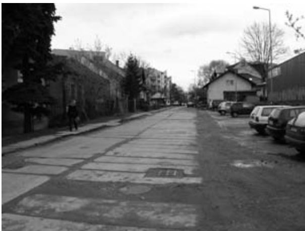
Najgorszy technicznie odcinek ul. Gdańskiej. Na ten fragment mamy już pozwolenie na budowę i trwają tam już pierwsze prace.