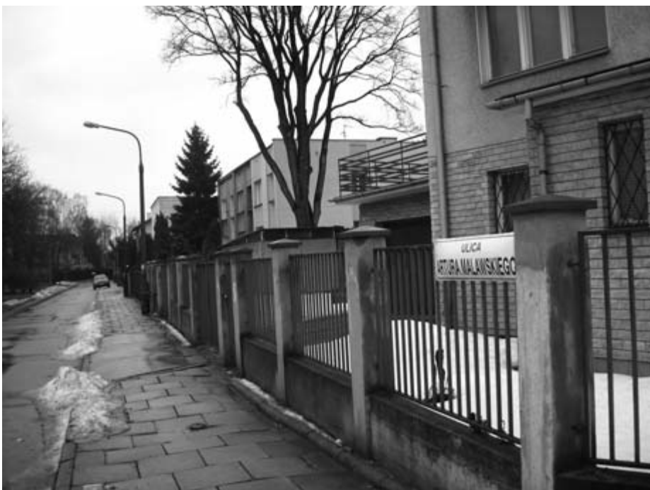
Ulica Artura Malawskiego na Olszy II.