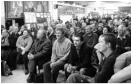
Uczestnicy spotkania w Szkole Podstawowej nr 114.

W trakcie przeprowadzonego pod koniec spotkania głosowania pisemnego, stosunkiem 32 do 16 zwyciężył wśród zaproszonych mieszkańców wariant płaski. Taki sam wariant został wcześniej pozytywnie zaopiniowany przez Radę Dzielnicy III Prądnik Czerwony podczas sesji 26 stycznia 2010 roku uchwałą nr 566. Radni wzięli pod uwagę zgłaszane przez okolicznych mieszkańców obawy przed nie tylko groźbą wyburzeń domów przy ul. Meissnera, ale także przed narastaniem ruchu tranzytowego przez teren całej Dzielnicy III poprzez zwiększenie przepustowości skrzyżowania. Obecnie w planach inwestycyjnych znajdują się pozycje nie tylko budowy ul. Lema łączącej al. Pokoju z al. Jana Pawła II, ale także projektowaną ul. Arcotowskiego, która ma połączyć al. Pokoju z ul. Nowohucką w pobliżu hurtowni Selgros. Z kolei planowane poszerzenie ul. Strzelców do 4 pasów jazdy w obie strony i budowa jej przedłużenia – projektowanej ul. Iwaszki – do al. 29 Listopada może spowodować, że od północnego wjazdu do miasta aż do granicy Podgórze przy Selgrosie stworzy się ciąg komunikacyjny, w który wleje się intensywny ruch samochodowy „przecinający” na pół naszą Dzielnicę. Przy braku wydolnych