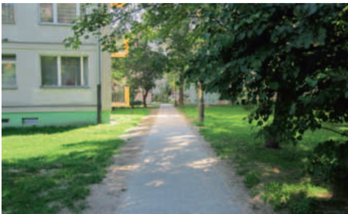
Chodnik przy ul. Włodkowska