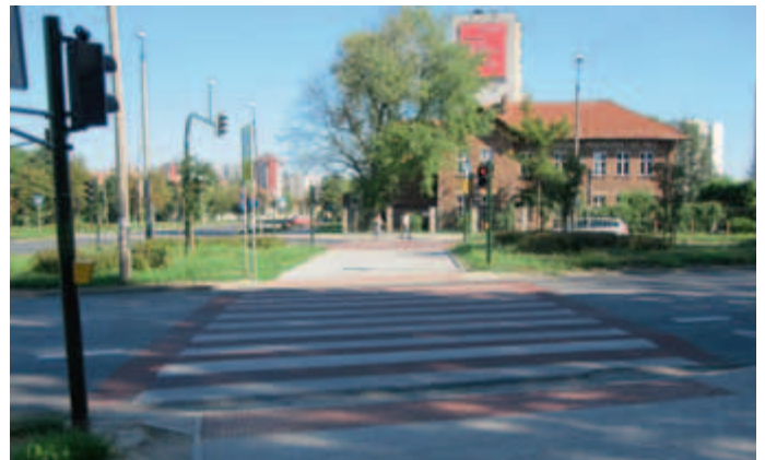
Rondo Młyńskie od strony ul. Pilotów