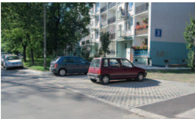
Miejsca parkingowe przy ul. Włodkowska