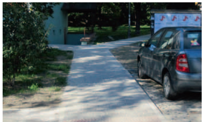
Przeście przez ul. Włodkowska