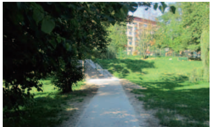
Chodnik przy ul. Włodkowska