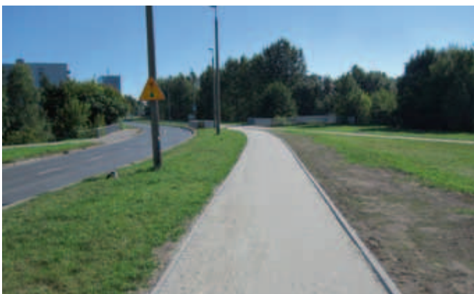
Chodnik przy ul. Strzelców