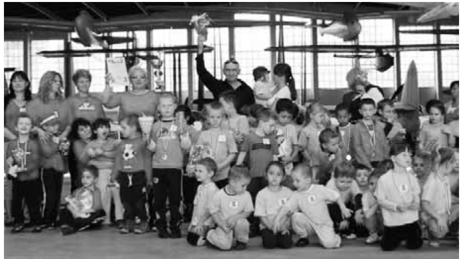
Fot. z archiwum Przedszkola nr 122

Muzeum Krzysztofa Radwana od dziewięciu już lat Przedszkole korzysta z pięknego terenu, aby zorganizować i przeprowadzić wspaniałą zabawę, integrację i sportową rywalizację przedszkolaków.