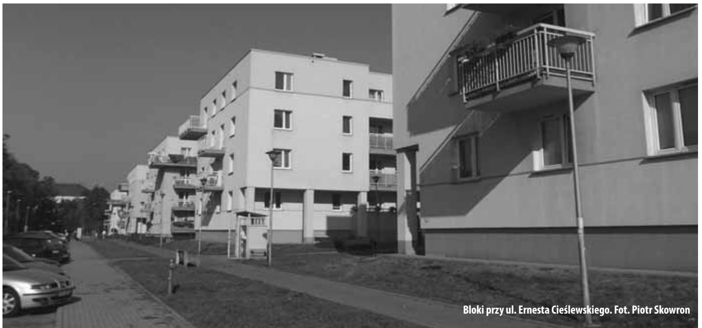
Bloki przy ul. Ernesta Cieśleńskiego.