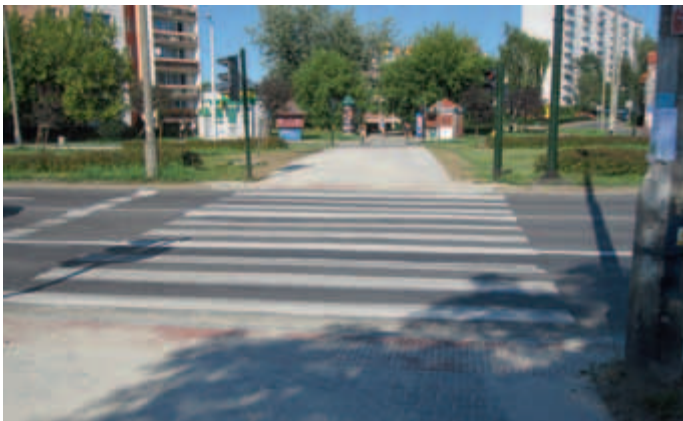
Rondo Młyńskie od strony ul. Młyńskiej