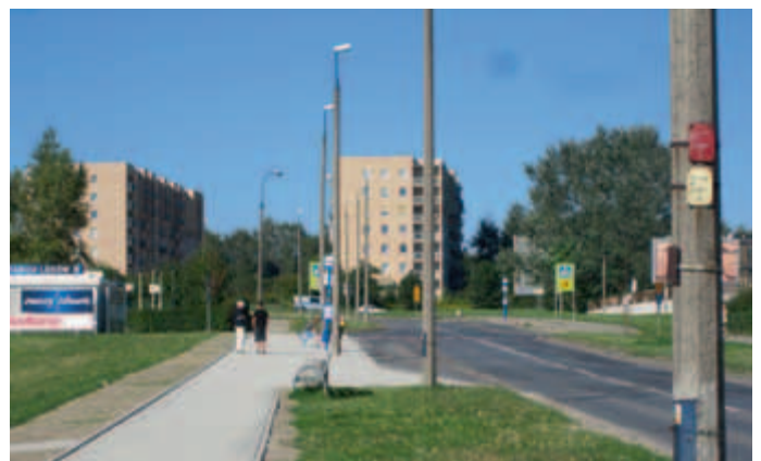
Przystanek przy ul. Strzelców