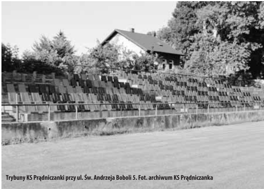
Trybuny KS Prądniczanki przy ul. Św. Andrzeja Boboli 5.

miejscu należy, iż w latach 1960-1990 w klubie było 11 sekcji sportowych i pół tysiąca członków! Nie wiele osób pamięta, że KS Prądniczanka to nie tylko piłka nożna, choć na pewno była i jest ona wiodącą dyscypliną uprawianą w naszym Klubie. Warto w tym miejscu wspomnieć o sukcesie drużyny seniorów, która w tym roku awansowała do ligi okrę-