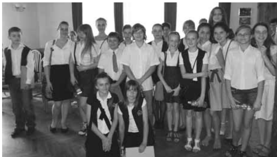
Nasi Goście ze Szkoły Podstawowej nr 95 – uczestnicy spotkania w siedzibie Rady Dzielniczy III.

Nagle znalazłam się na miękkim materacu, przykryta złotą kołdrą. „Ale super” – pomyślałam, gdy młody służący przyniósł mi suknię, jaką nosiły królowe w dawnych wiekach. Następnie zjawił się nauczyciel, wręczył mi zwój pergaminu i coś, co przypominało ołówek. Zaczęłam pisać. Wychodziło mi