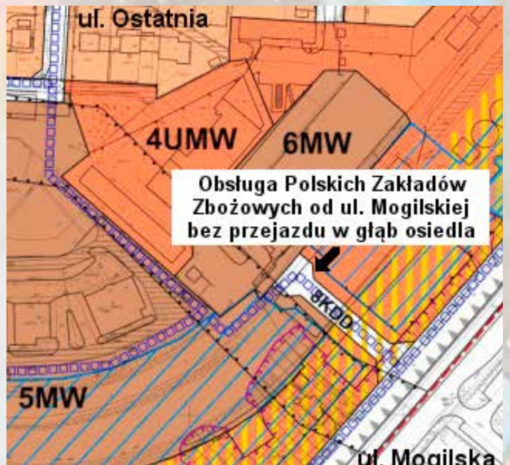
Obsługa Polskich Zakładów Zbożowych od ul. Mogilskiej to realizacja postulatu mieszkańców os. Wieczysta.