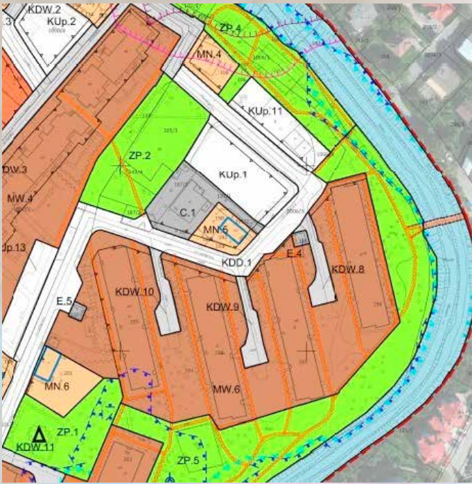
Powyższy rysunek przedstawia fragment projektu planu obszaru Wileńska (os. Wiśniowa) chroniącego cenne tereny rekreacyjne wzdłuż rzeki Białucha (kolor zielony).