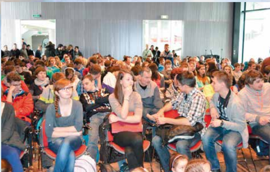
Uczestnicy konkursu