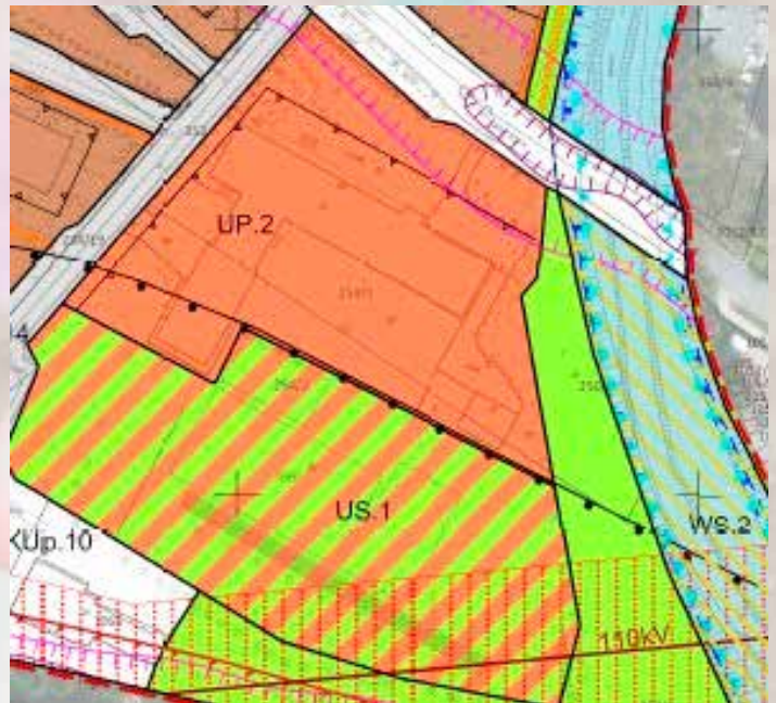
Powyższy rysunek przedstawia zapisy projektu planu obszaru Wileńska (os. Wiśniowa) dot. Szkoły Podstawowej nr 95, teren UP 2 (czerwony) ogranicza przeznaczenie budynku szkoły do funkcji edukacyjnej (szczegółowe zapisy znajdują się w części tekstowej planu) natomiast teren US.1 (czerwono-zielony) utrzymuje funkcję boisk sportowych w miejscu, w którym znajdują się one obecnie. Takie zapisy uniemożliwiają zmianę zagospodarowania terenu szkoły na inne cele niż oświatowe.