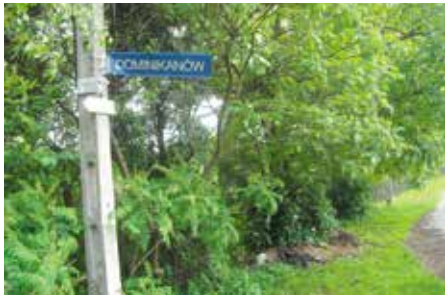
Fragment ul. Dominikanów.

Dominikanie to katolicki, męski zakon kaznodziejski założony w 1216 r. przez św. Dominika. Hiszpan Dominik Guzman już jako kapłan odbywał liczne podróże, głosząc kazania, prowadząc dysputy z heretykami, pogłębiając też stale swą wiedzę w zakresie nauk teologicznych i filozoficznych. Podobnie dominikanie w swojej działalności nie ograniczali się tylko do nawracania miejscowej ludności, ale również ewangelizowali ludność, mając odpowiednie przygotowanie teologiczne i oratorskie. Za główne swoje zadania uważali