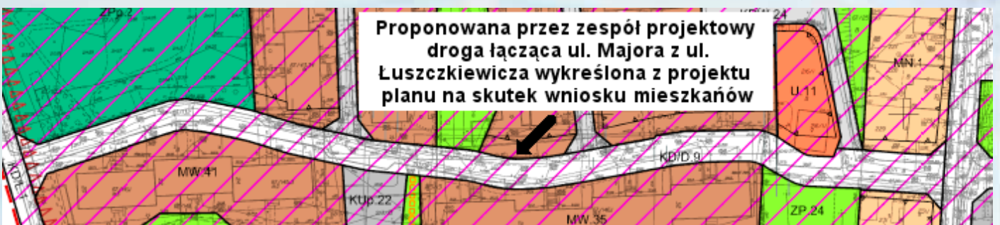
Poniziej przykład, że warto być aktywnym: proponowana przez zespół projektowy droga łącząca ul. Majora z ul. Łuszczkiewicza wykreślona z projektu planu na skutek wniosku mieszkańców (Plan Prądnik Czerwony - Północ).