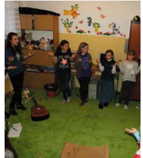
Zajęcia na świetlicy.

18 kwietnia nastąpiło uroczyste otwarcie i poświęcenie przez o. Józefa Matrasa SP, prowincjała Zakonu Pijarów nowego dzieła pijarskiego – Świetlicy św. Doroty mieszczącej się przy ul. Dzielskiego 1. Własnymi siłami, dzięki uporowi i pasji powstało niesamowite miejsce, przyjazne dzieciom oraz rodzicom z całej parafii w Rakowicach.