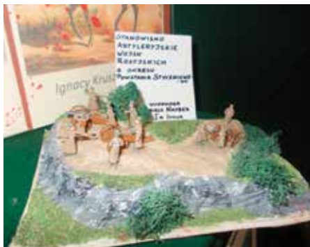
Przeciwnik w miniaturze. Bateria rosyjskiej artylerii z okresu powstania styczniowego na dioramie w skali 1:72.