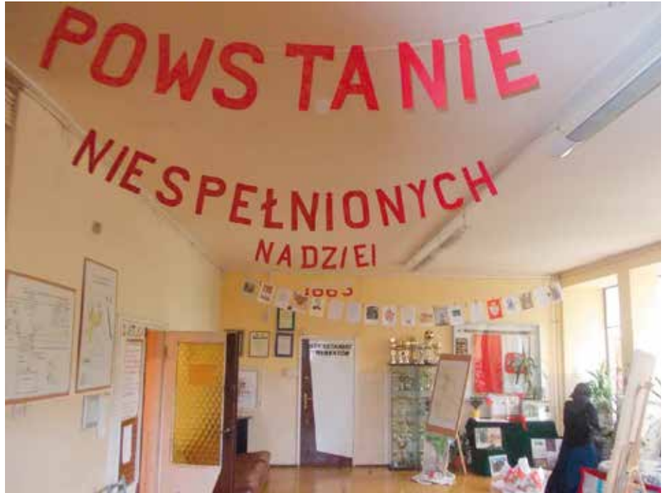
Wystawa w hallu Szkoły Podstawowej nr 95.

powstańców. „Ich groby mają jednolitą formę, a fundowane były przez Polskie Towarzystwo Opieki nad Grobami Bohaterów. Większość tych grobów nie była od lat konserwowana” pisała do prezydenta radna.