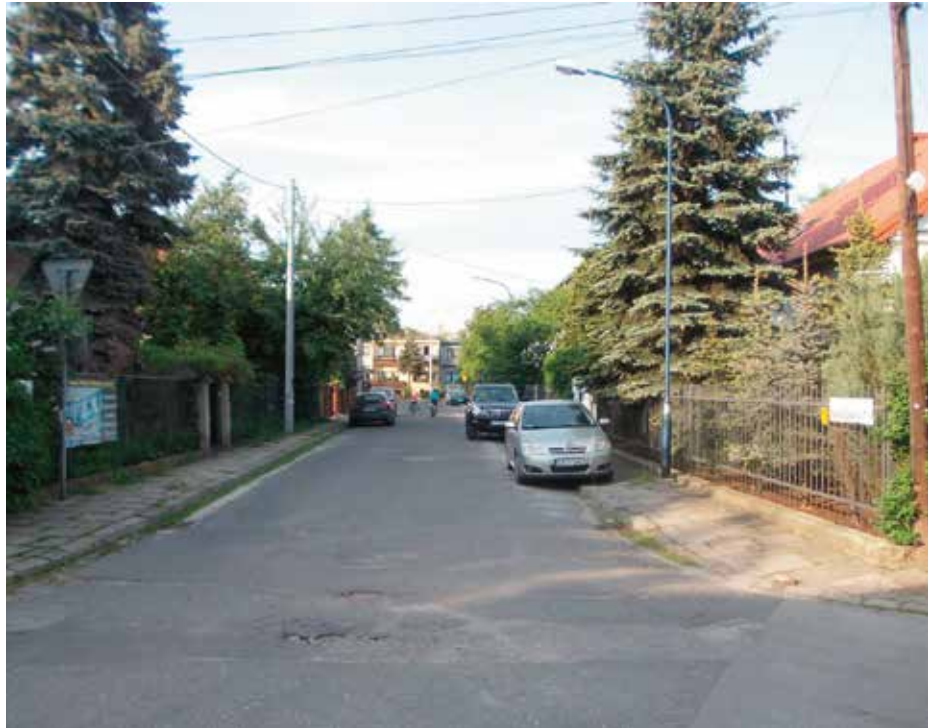
Ulica Franciszka Kajty mogłaby się dziś nazywać inaczej, gdyby Rada Dzielnicy III w 2010 roku poparła pomysł zmiany jej nazwy, koszty ponieśliby mieszkańcy. Jednak wobec braku akceptacji mieszkańców co do propozycji zmiany, radni Dzielnicy III zdecydowali się odrzucić wniosek o zmianę nazwy.

Czy mieszkańcy ul. Kajty są zwolennikami minionego ustroju, działaczy PPR, ich mocodawców i popełnionych zbrodni komunistycznych? Zapewne nie, przypuszczam, że bardziej obawiali się fatygi oraz możliwych kosztów związanych z koniecznością zmiany adresu i wymiany dokumentów. A musieliby w takim przypadku przecież zmieniać dane m.in. w dowodach osobistych, prawach jazdy, dowodach rejestracyjnych, w organach prowadzących ewiden-