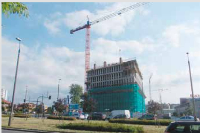
Obecny stan budowy inwestycji Alma Tower.

– 26, powstanie dodatkowo 50 miejsc na parkingu strzeżonym dla rowerów. Budynek jest realizowany z założeniami certyfikatu LEED, wykorzystywane techno-