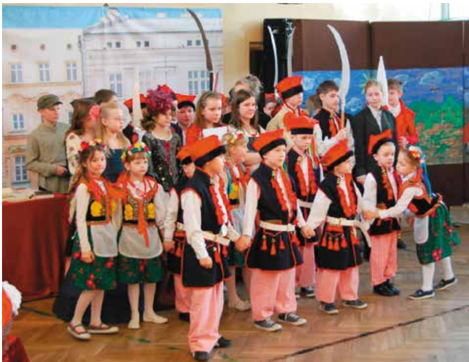
Uroczystości 65 lat później.