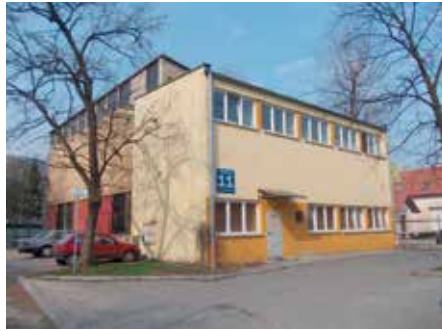
Budynek dawnej osiedlowej kotłowni przy ul. Młyńskiej Bocznej 11.