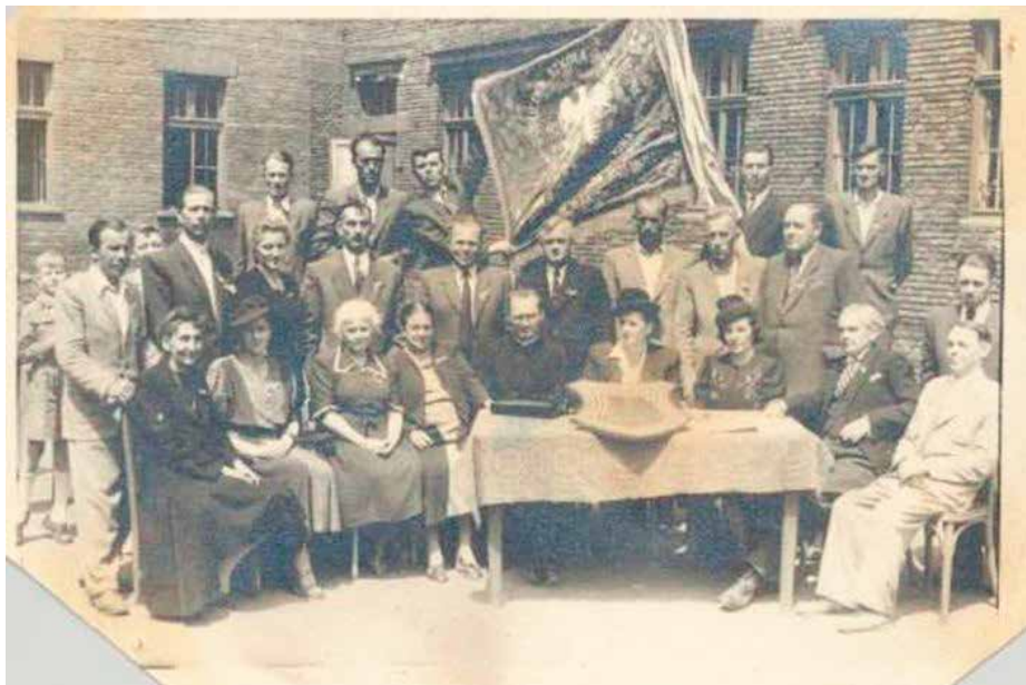
Uroczystość nadania imienia Szkole w 1947 roku