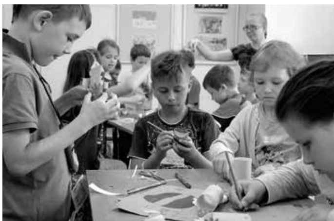
Zajęcia plastyczne - przygotowania do gry planszowej