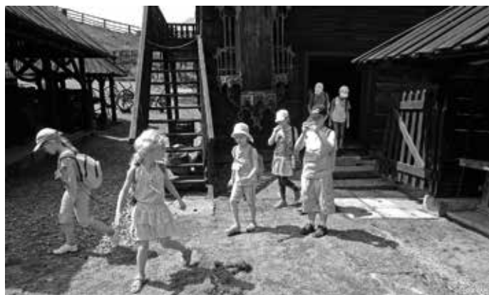
Wycieczka do Dobczyc - zwiedzanie zamku i skansenu