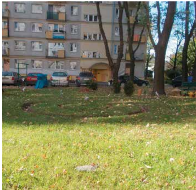
Fot. Mateusz Drożdż