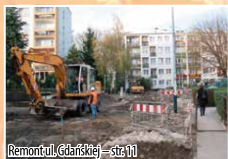
Remont ul. Gdańskiej – str. 11