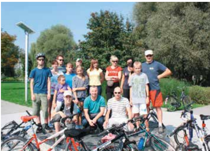
Trzecia edycja „Rowerem po wodzie”.

Polskie Towarzystwo Kulturalne Oddział Kraków