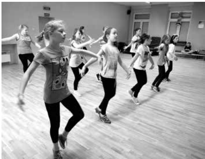
Warsztaty tańca klasycznego i street dance