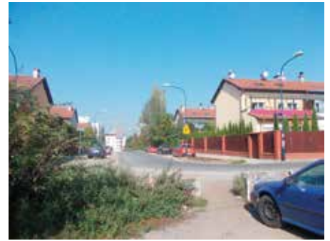
Ul. Jana Sabały.

Gawędy góralskie, autorstwa Sabały lub powtarzane przez niego, zostały spopularyzowane m.in. przez Stanisława Witkiewicza - „Na przełęczy”, Henryka Sienkiewicza - „Sabałowa bajka”, Kazimierza Przerwę-Tetmajera - „Legenda Tatr”, Władysława Or-