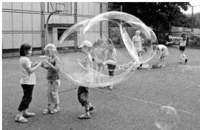
Zabawy na boisku MDK - puszczenie baniek mydlanych