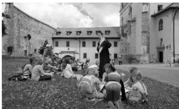
Wycieczka do Opactwa Benedyktynów w Tyńcu