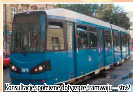
Konsultacje społeczne dotyczące tramwaju – str. 2