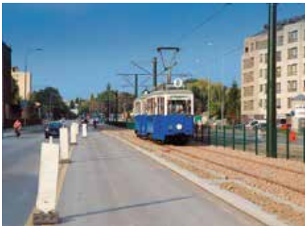
Zabytkowy tramwaj linii 0 na ul. Mogiłskiej.

Linia tramwajowa 0, tak jak w poprzednich latach, kursowała w krótszym wariantcie z Muzeum Inżynierii Miejskiej do Cichego Kącika oraz w dłuższej wersji z Muzeum do Kopca Wandy. Z powodu licznych remontów torowisk zmieniała ona kilku-