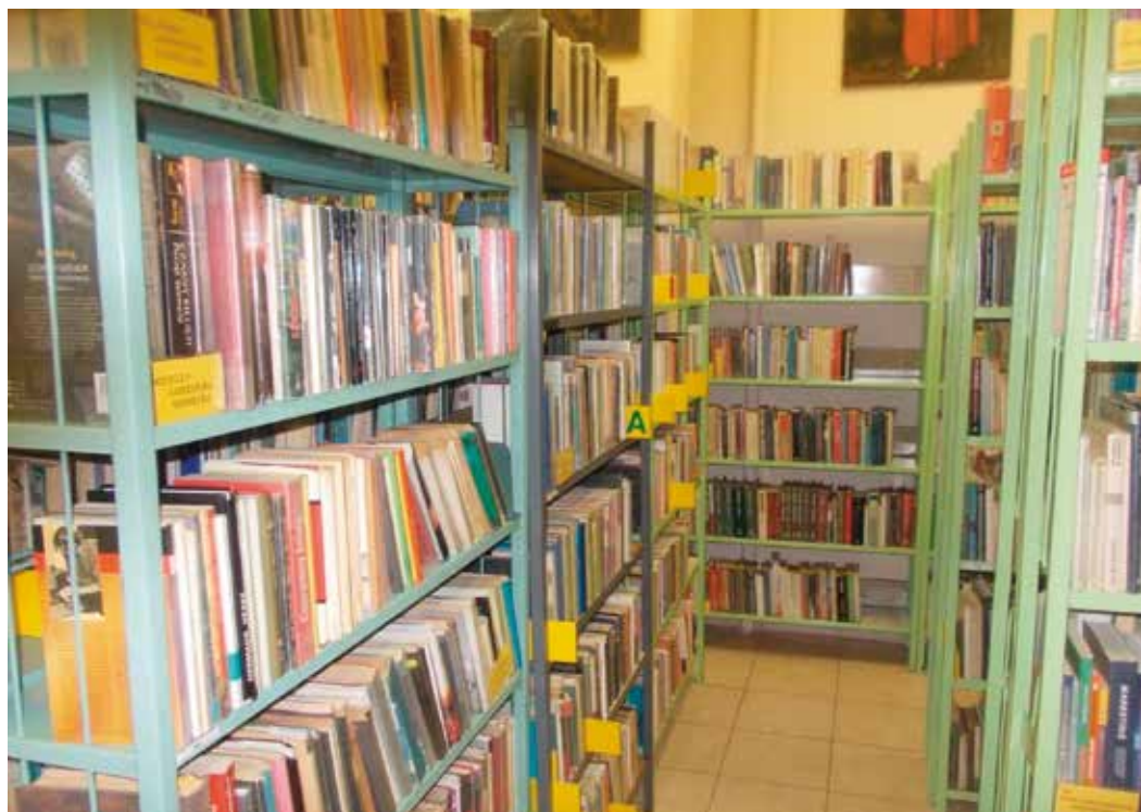
Zwycięski projekt „Książka bliżej Ciebie i dla Ciebie” nie tylko wzbogaci biblioteczne półki, ale i umożliwi realizację kilku innych projektów zgłoszonych do Budżetu Obywatelskiego.

Będąc radnym Dzielnicy III zawsze głosowałem za przyznawaniem pieniędzy bibliotekom na zakup nowości, ale niestety, nigdy nie było ich wystarczająco