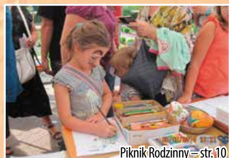
Piknik Rodzinny – str. 10