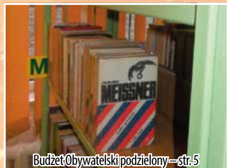
Budżet Obywatelski podzielony – str. 5