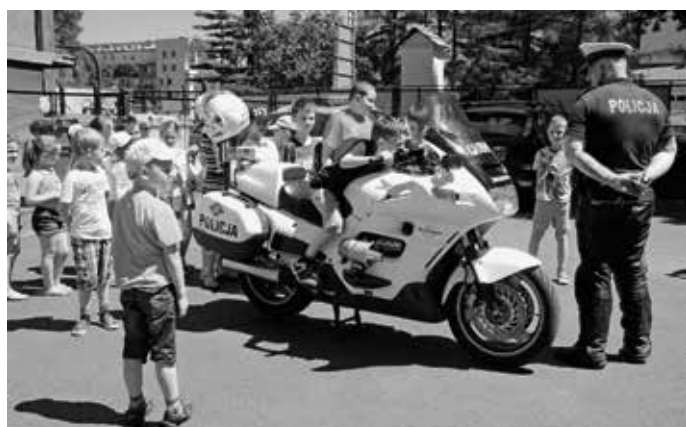
Spotkanie z przedstawicielami policji - pokaz i prelekcja