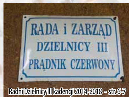
Radni Dzielnicy III kadencji 2014-2018 – str. 6-7