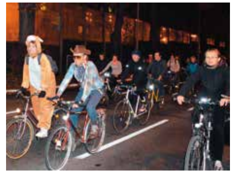
Przejazd świetlnej Masy Krytycznej ul. Lublańską.

Historia Masy jednak się nie zakończyła. 1 kwietnia z okazji Światowego Dnia Wiedzy Na Temat Autyzmu miał miejsce przejazd rowerowy „Wkręć się w autyzm!”. 25 kwietnia odbył się pierwszy Masowy Przejazd Rowerowy będący następcą Masy Krytycz-