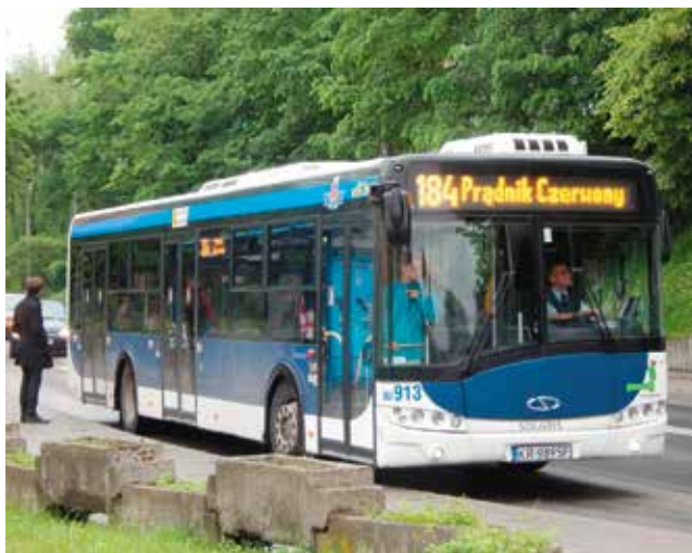
Krótki autobus linii 184 kursujący w czasie weekendów.