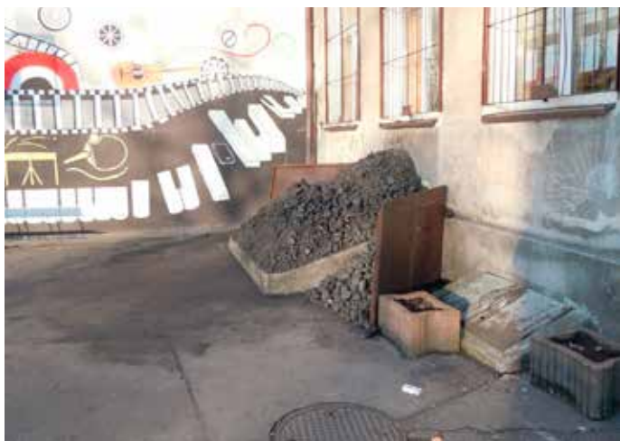
Termomodernizacja Młodzieżowego Domu Kultury przy al. 29 Listopada zlikwiduje tamtejsze piece węglowe.