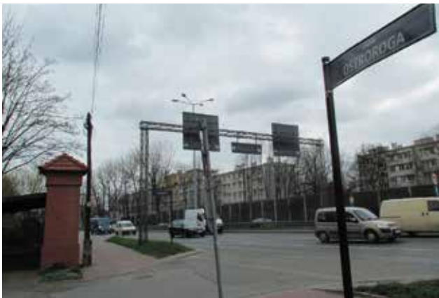
Ul. Jana Ostroroga w Dzielnicy III.

T. J. Adamczewscy - „Kraków, ulica imienia...” R. Kościeszka Kułakowski - „Polacy Jan Ostroróg” Wikipedia