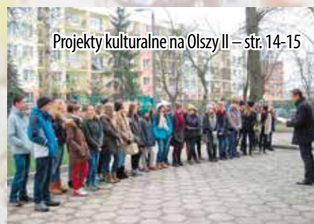
Projekty kulturalne na Olszy II – str. 14-15