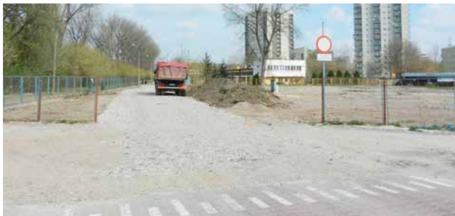
Przebieg obecnej drogi technicznej, która będzie w przyszłości ulicą łączącą ul. Mogiłską z ul. Ostatnią.

Oprócz remontów dróg dzięki moim działaniom wykonana zostanie kompleksowa termomodernizacja budynku Młodzieżowego Domu Kultury przy al. 29 Listopada, likwidacji ulegną piece węglowe, a cały obiekt zostanie dostosowany do przepisów przeciwpożarowych. Kolejną przygotowywaną in-