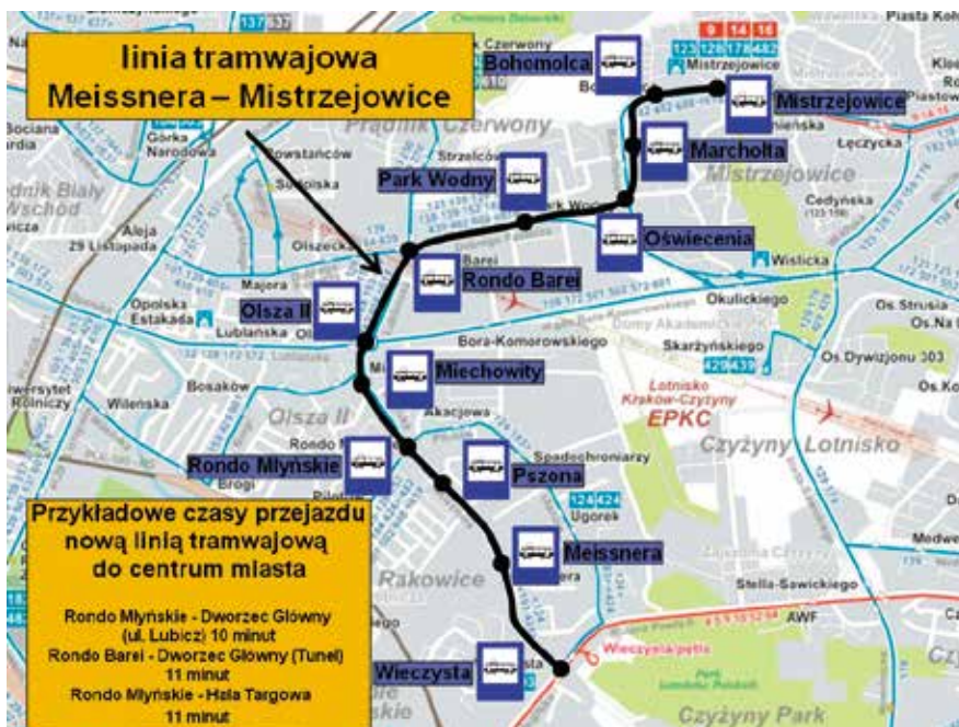
Nowa linia tramwajowa to jedyna szansa na sprawną komunikację w naszej Dzielnicy. Powyżej przedstawiono przykładowe czasy przejazdu tramwajem.