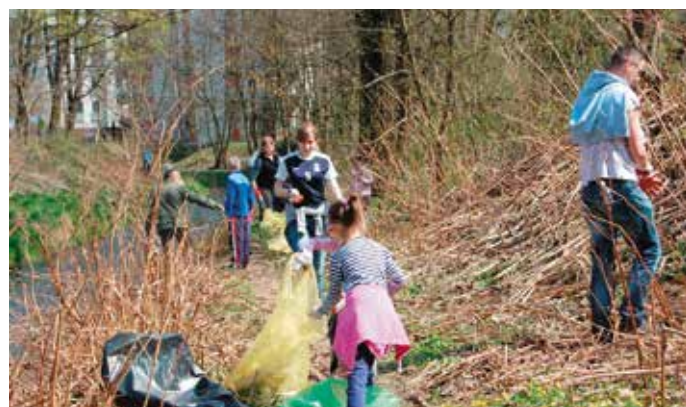
11 kwietnia 2015 r. - sprzątanie brzegów Białuchy