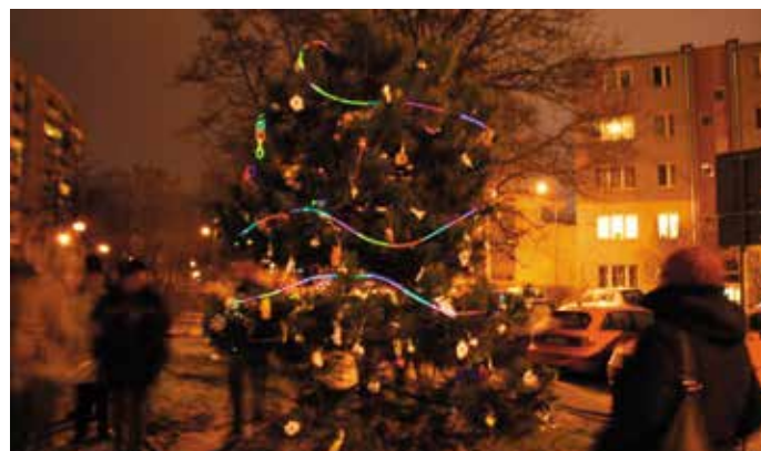
18 grudnia 2014 r. - ubieranie choinki przy ul. Celarowskiej