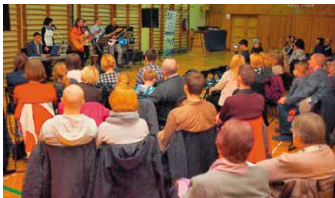
14 stycznia 2015 r. - koncert kolęd w Szkole Podstawowej nr 95