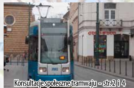
Konsultacje społeczne (tramwaju) – str. 2 i 4