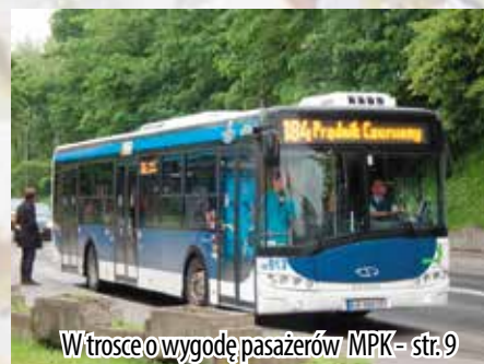
W trosce o wygodę pasażerów MPK – str. 9