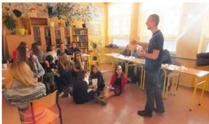
13 grudnia 2014 r. - warsztaty dotyczące „praw i obowiązków”