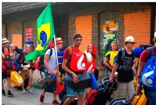
Pielgrzymi z Brazylii na ul. Dobrego Pasterza w drodze na kwatery.

Pierwsi pielgrzymi przybyli 24 lipca. Łącznie gościliśmy ok. 890 osób z 16 krajów, m.in.: Japonii, Francji, Korei, Tanzanii, Tajwanu, Malty, USA, Libanu, Filipin i Szwajcarii. Zostali oni powitani radosną piosenką oraz poczęstowani chlebem i solą przez wolontariuszki ubrane w tradycyjny strój krakowski. Wyjątkowymi gośćmi byli m.in. kardynał Vincent Nichols, prymas Anglii i Walii, oraz kardynał Laurent Monsengwo Pasinya z Kinszasy, członek Rady Kardynałów. Podczas Festiwalu Młodych koncert poprowadziła francuska wspólnota Jeunesse Lumiere. Kościół był pełen młodych ludzi od rana do wieczora. Każdy dzień przepełniony był radością płynącą ze spotkań. Młodzi ubogacali się nawzajem, otwierając się na siebie, swoją kulturę, poznając swoje tradycje i obyczaje danego kraju.