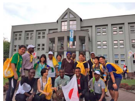
Pielgrzymi z Japonii i Tanzanii w parafii Pana Jezusa Dobrego Pasterza.

Większość pielgrzymów przyjechała w poniedziałek i wtorek. Łącznie gościliśmy 1296 osób z 19 krajów, choć najczę-