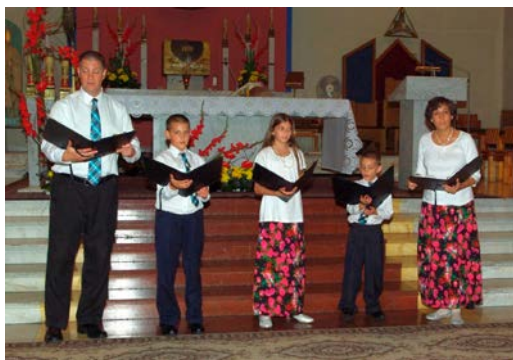
Koncert The Mueller Family Schola w kościele św. Jana Chrzciciela.

się w organizację tego wydarzenia. Składamy gorące podziękowania wolontariuszom, Rycerzom Kolumba, służbie kościelnej i parafianom za godne przyjęcie pielgrzymów w mieszkaniach oraz za dyżury, ofiarowane ciasta i różne produkty do poczęstunku. Z okazji ŚDM wydano specjalny nu-