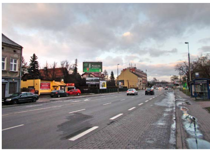
Al. 29 Listopada w okolicach skrzyżowania z ul. Dobrego Pasterza.