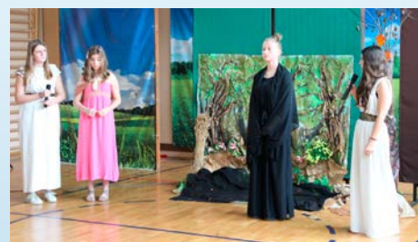
Festiwal Małych Form Teatralnych w Szkole Podstawowej nr 64 – str. 2