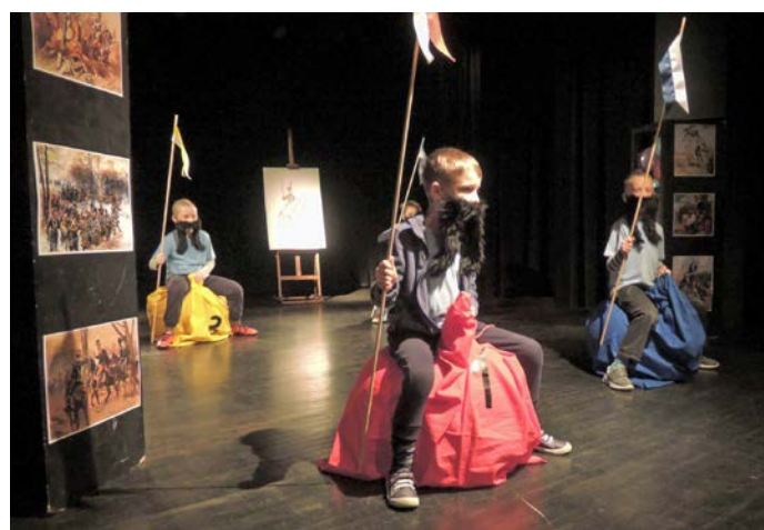
Ułańska fantazja w Młodzieżowym Domu Kultury przy al. 29 Listopada 102.