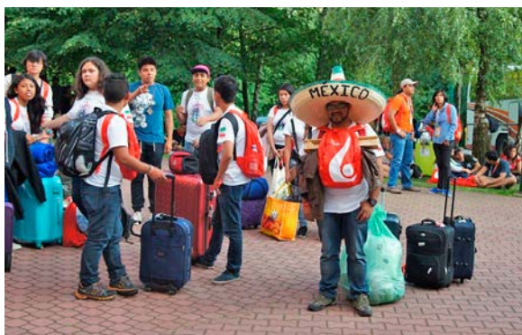
Pielgrzymi z Meksyku na Wieczystej.

3 października w parafii odbył się koncert w klimacie Światowych Dni Młodzieży „Przeżyjmy to jeszcze raz” dedykowany wszystkim zaangażowanym w pomoc przy organizacji ŚDM, przygotowany przez Duszpasterstwo Akademickie Pijarów. Było to połączenie wspomnień wolontariuszy, uczestników i parafian oraz utworów wykonywanych podczas ŚDM.