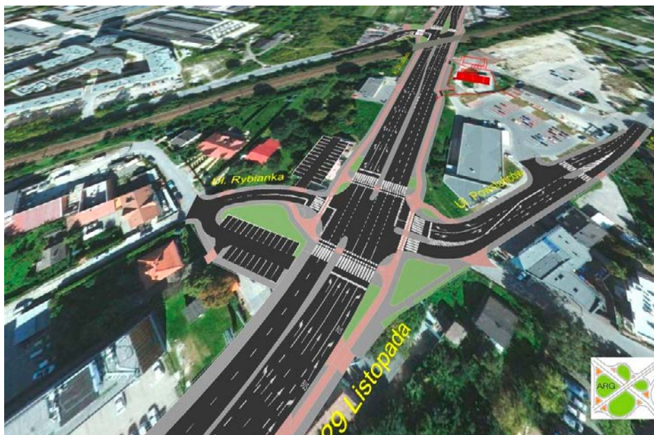
Wizualizacja skrzyżowania al. 29 Listopada z ul. Powstańców.

Czy remont al. 29 Listopada może stać się odwróceniem trendu, o którym od lat piszą i alar-