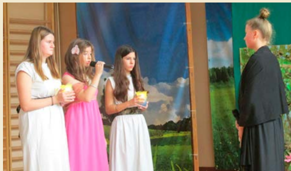
„Noc Listopadowa” w wykonaniu aktorek z Gimnazjum nr 9.

Stanisław Wyspiański był dosyć trudnym tematem szczególnie w szkołach podstawowych. Tu należy podkreślić duże zaangażowanie nauczycieli i uczniów w przygotowaniu prezentacji, aby spektakl był przejrzysty i zrozumiały dla każdego widza. Każda koncepcja była inna i niejednokrotnie oparta na dobrze dobranym podkładzie muzycznym lub z udziałem własnego