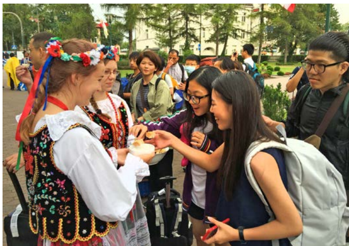
Powitanie pielgrzymów w parafii Pana Jezusa Dobrego Pasterza.