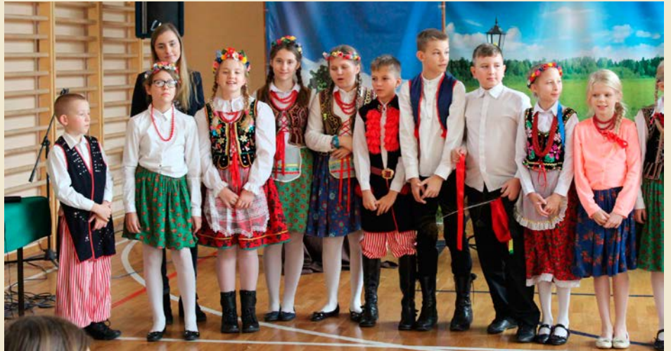
Aktorzy ze sztuki „Wesele u Stasia” przygotowanej przez SP nr 114

Szkoła nr 114 pod kierunkiem Magdaleny Leśniak i Anety Kasprzyckiej wraz z aktorami