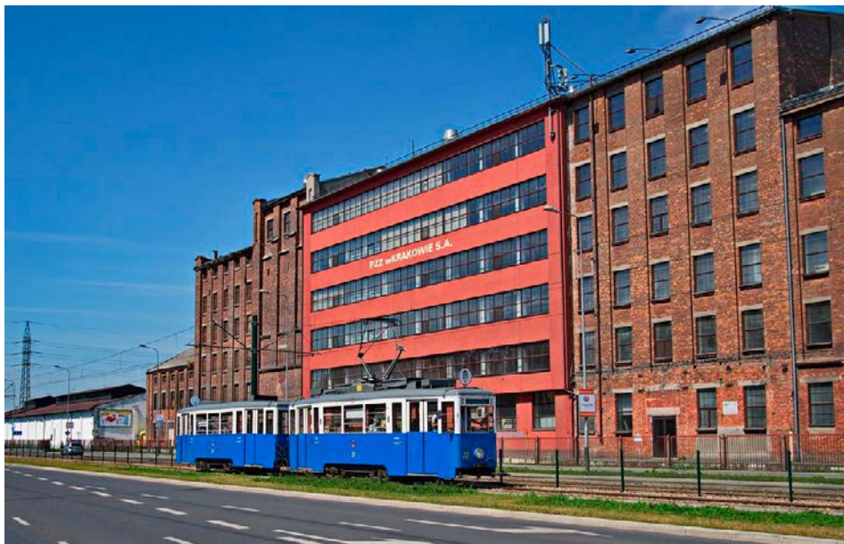
Linia 0 na ul. Mogiłskiej.

Krakowska Linia Muzealna to specjalna linia tramwajowa organizowana od 2003 r. przez Krakowski Klub Modelarzy Kolejowych, Miejskie Przedsiębiorstwo Komunikacyjne oraz Zarząd Infrastruktury Komunalnej i Transportu, kursująca we wszystkie niedziele i święta w okresie letnim po Krakowie, która jest obsługiwana zabytkowym taborom tramwajowym. Jako dodatkowa atrakcja kilkakrotnie podczas wakacji od 2006 r. uruchamiane są także historyczne autobusy. Od 2009 r. zabytkowe tramwaje kursują na linii 0 z Cichego Kącika do Muzeum Inżynierii Miejskiej, a od 2012 r. również na dodatkowej trasie z Muzeum Inżynierii Miejskiej do Kopca Wandy, która wiedzie ul. Mogiłską i al. Jana Pawła II przez os. Wieczysta na południu naszej Dzielnicy.