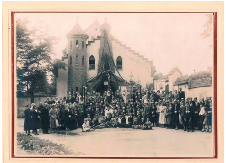
Rakowiczanie przed pijarską kaplicą Najśw. Imienia Maryi przy obecnej ul. Dzielskiego, 1933 r.

Wracając do Rakowic, ich duchowym i oświatowym centrum była historyczna pijarska parafia pw. Najświętszego Imienia Maryi, a do tej parafii należały przez wiele dziesięcioleci właśnie: Olsza (właściwie obie Olsze: Stara i Olsza II), osiedle Wieczysta, Ugorek i obecna Fiołkowa, na dawnym terenie ogrodu Freegego, Akacja, lotnicza jednostka wojskowa z najstarszym polskim lotniskiem wojskowym Rakowice, potem tzw. „Czerwone Berety” z 6. Pomorskiej Dywizji Powietrzno-Desantowej, tereny mokrader i bo-