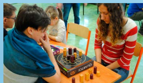
Festiwale Gier Logicznych w Szkołach Podstawowych nr 114 i 95 – str. 15