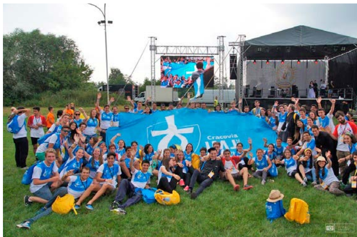
Pielgrzymi na stadionie KS Wieczysta.