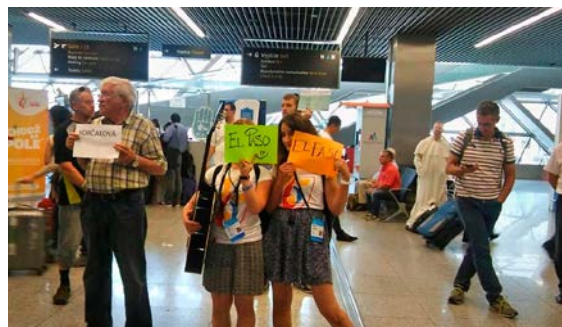
Wolontariuszki z Rakowic oczekują na pielgrzymów z El Paso na lotnisku w Balicach.