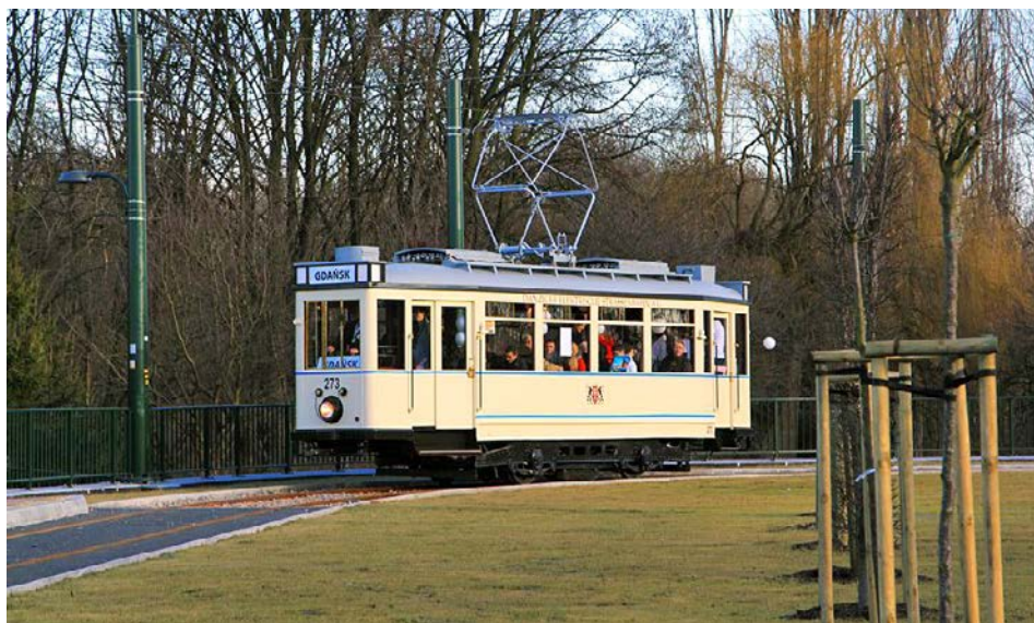
Tramwaj Ring na pętli Wieczysta.