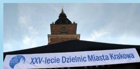
25-lecie funkcjonowania Rad Dzielnicy Miasta Krakowa – str. 7