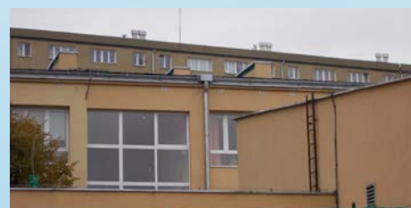
Reforma czy deforma szkolnictwa? – str. 4