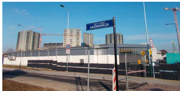
Ul. Stefana Łaskiewicza, na drugim planie osiedle przy ul. Ostatniej.

- Tak jest... Tak jest. Ale jak nie usmażę szynki na czas, to ani ścierka, ani ręcznik nie pomoże”.