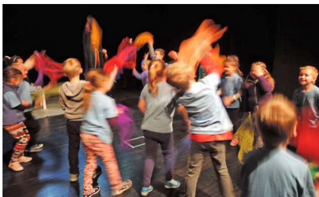
Andrzejkowe wróżby w Młodzieżowym Domu Kultury przy al. 29 Listopada.

Podczas spotkania dzieci próbowały poznać: co je czeka w najbliższej przyszłości, imię swojego przyszłego męża/żony przez wy-