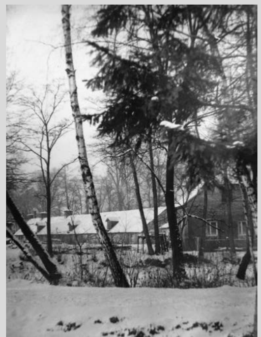
Zabudowania folwarku pijarskiego w Rakowicach.

Kurator wystawy o Rakowicach Muzeum Historyczne Miasta Krakowa