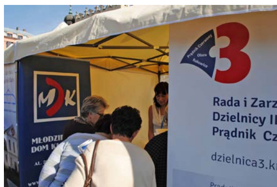
Uroczystości 25-lecia Rad Dzielnic Miasta Krakowa na Rynku Głównym.