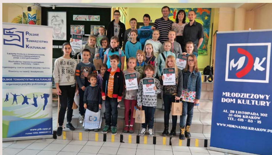
Festiwal Gier Logicznych w Szkołach Podstawowych nr 114 i 95.