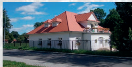
Tu rodziła się wolność rakowickiego lotniska – str. 12-13

Nowa Rada Dzielnicy III Prądnik Czerwony zostanie zwołana już po zamknięciu tego numeru gazety. O tym, kto zostanie przewodniczącym, kto będzie w zarządzie, jakie będą komisje merytoryczne i kto będzie nimi kierował, będziecie mogli Państwo dowiedzieć się z informacji na stronie internetowej Rady Dzielnicy III: www.dzielnica3.krakow.pl .