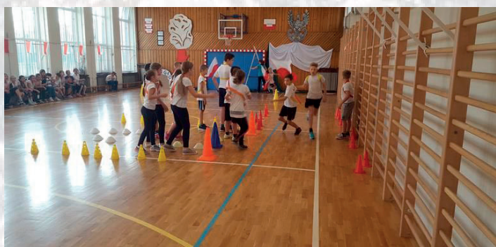
Bieg Niepodległości w Szkole Podstawowej nr 95