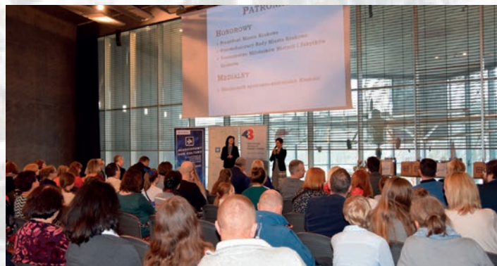
... przybyli wraz z rodzicami