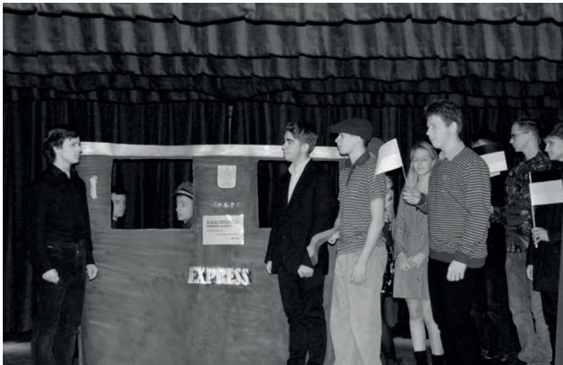
Konkurs teatralny „Jeszcze Polska nie zginęła” w Zespole Szkół nr 1.

Składał się z dwóch części. Pierwsza poświęcona była znajomości wydarzeń historycznych, które złożyły się na odzyskanie niepodległości. Po wystudowaniu wykładu wygłoszonego w Dziale Edukacji Instytutu Pamięci Narodowej „Przystanek Historia” przystąpiono do rozwiązywania testu. Druga część miała formę gry terenowej w Muzeum Czynu Niepodległościowego na Oleandrach i Parku Jordanu. Uczestnicy znaleźli się w miejscach skąd wyruszyła 1. Kompania Kadrowa. Wśród zadań znalazły się odczytanie szyfru wojsk rosyjskich z I wojny światowej, udzielenie pierwszej pomocy rannemu żołnierzowi i przetransportowanie go