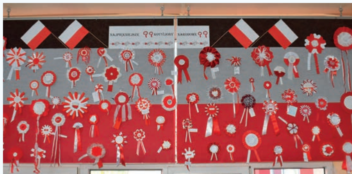
Efekty konkursu na najpiękniejszy kotylion narodowy w Szkole Podstawowej nr 114