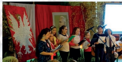
Tak świętowaliśmy niepodległość – str. 2, 6-8