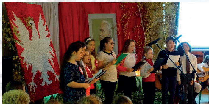
Wieczór pieśni patriotycznej w Szkole Podstawowej nr 2