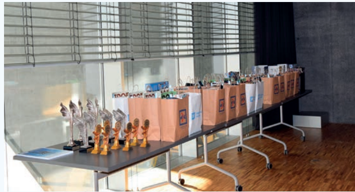
Nagrody dla laureatów i wyróżnionych ufundowane przez organizatorów i patronów honorowych konkursu