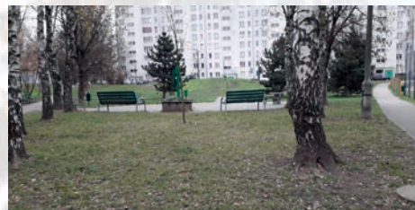
Szansa na park kieszonkowy w Rakowicach – str. 4