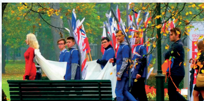
Uczestnicy widowiska Duma i Radości