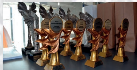
Rozstrzygnięcie konkursu „Patroni krakowskich ulic” – str. 14-15