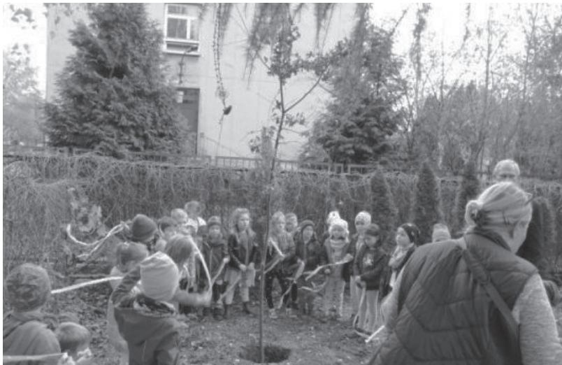
Zasadenie Dębu Niepodległości w Przedszkolu nr 123. Fot. Przedszkole nr 123

Młodzieżowy Dom Kultury z al. 29 Listopada w ramach cyklu „Tradycja z nutą i kolorem” zorganizował 10, 13 i 20 listopada widowisko interaktywne dla dzieci „Biało-czerwona szachownica opowiadające