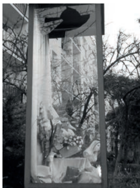
Zniszczona kapliczka.

W nocy z 14 na 15 listopada 2018 r. miała miejsce profanacja kapliczki, w wyniku której została rozbita figura Matki Bożej i chrońące ją szyby. Zawiadomienie o tym zdarzeniu zostało złożone przez Parafię Najśw. Imienia Maryi na Komisariacie Policji III. Na