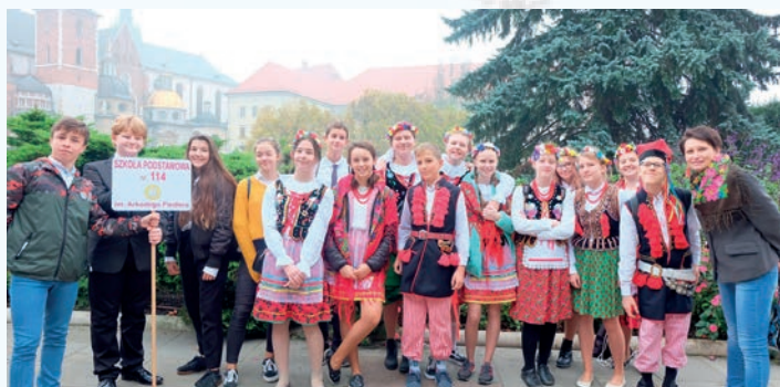
Uczniowie Szkoły Podstawowej nr 114 podczas widowiska Duma i Radości