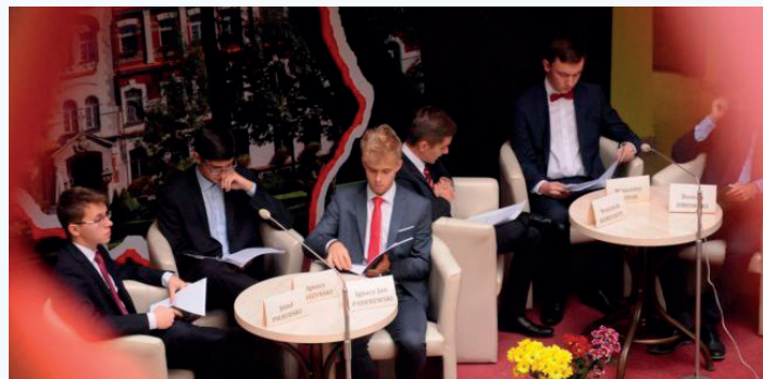
Dialog Ojców Niepodległości w Liceum Ogólnokształcącym Zakonu Pijarów