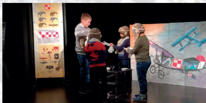
Interaktywne widowisko „Biało-czerwona szachownica” w Młodzieżowym Domu Kultury przy al. 29 Listopada 102