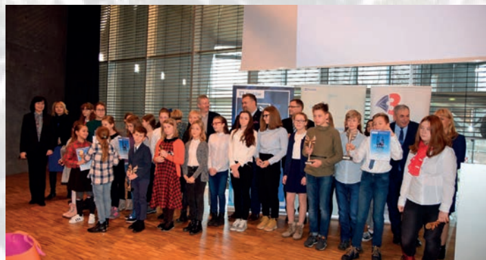
Pamiętkowe zdjęcie laureatów, wyróżnionych wraz z organizatorami i patronami honorowymi.