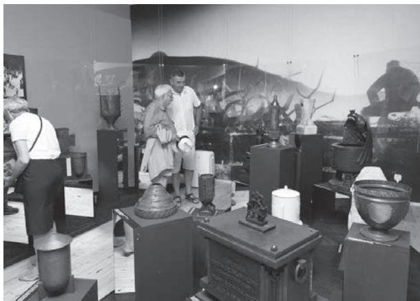
Wystawa „Kopiec pamięci”.

Ważnym elementem wznoszenia stożka ku czci Marszałka była przywożona ziemia z pól bitewnych, gdzie żołnierz polski przelewa krew za wolność Ojczyzny – stąd inna nazwa Kopca: „Mogiła Mogił”. Ta symboliczna ziemia pobierana uroczystie w obecności lokalnych władz umieszczana w specjalnie