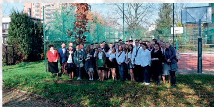
Zasadzenie dębu przed Gimnazjum nr 9