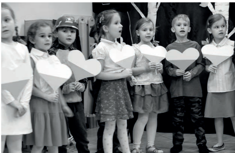
Wieczornica w Przedszkolu nr 14.

o początkach lotnictwa w Krakowie. 1 grudnia w ramach cyklu „Okno w historię” odbył się spacer „Niepodległość w Rakowicach – ułani i lotnicy” organizowany wspólnie z Radą Dzielnicy III, który poprowadził Mateusz Niemiec z Muzeum Historycznego Miasta Krakowa.