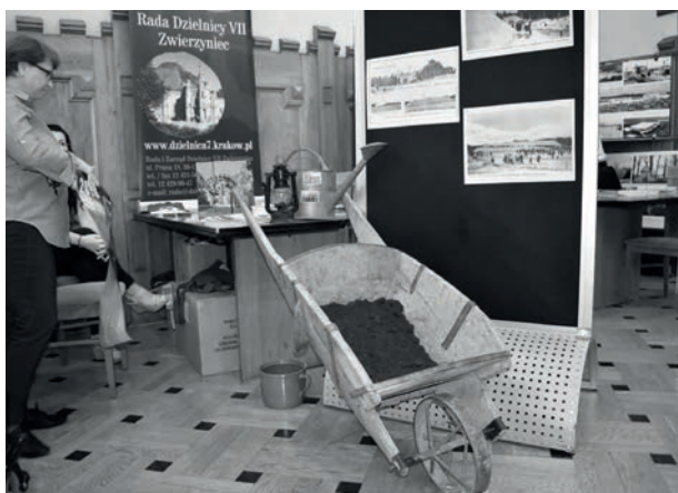
Taczki, którymi wożono ziemię w trakcie budowy Kopca. Stanowisko Rady Dzielnicy VII Zwierzyniec podczas Dnia Otwartego Magistratu.

przygotowanych na ten cel urnach z towarzyszącym jej protokołem pobrania przywożona była przez delegacje i składana w Kopcu. Dlatego też zaprezentowaliśmy wybrane z kolekcji MHK oraz innych instytucji urny, które w 1936 r. znajdowały się na wystawie „1000 urn” w odwachu przy Wieży Ratuszowej. Do ciekawych eksponatów zaliczają się także zgromadzone pamiątki, które można było zakupić na Sowińcu przy okazji prac nad pomnikiem: karty pocztowe z okolicznościami znaczkami, miniaturowe taczki drewniane bądź blaszane i przede wszystkim małe łopatki z pamiątkową inskrypcją, medale i przypinki.