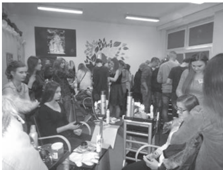
Styczniowe Targi Szkół Zawodowych od zawsze cieszą się dużym zainteresowaniem młodzieży.

Już dziś zapraszamy do wzięcia udziału w XVII „Styczniowych Targach Szkół Zawodowych w Melioraku”. Zapewniamy, że 31 stycznia 2019 r. stworzymy niepowtarzalną okazję dokładnego poznania, w ciągu jednego dnia i w jednym miejscu, dzięki bardzo zróżnicowanym formom, oferty edukacyjnej niemalże wszystkich krakowskich szkół technicznych, których nazwy bardzo często mają niewiele wspólnego z proponowanymi przez nie kierunkami kształcenia. Najlepszym tego przykładem jest organizator imprezy – Zespół Szkół Inżynierii Środowiska i Melioracji, kształcący w wielu zawodach na poziomie technikum, które zupełnie nie wynikają z jego nazwy, takich jak: technik organizacji reklamy, technik architektury krajobrazu, technik urządzeń i systemów energetyki odnawialnej, technik usług fryzjerskich, technik ogrodnik i wreszcie – technik inżynierii środowiska i melioracji, a na poziomie szkoły branżowej – w zawodzie fryzjer.