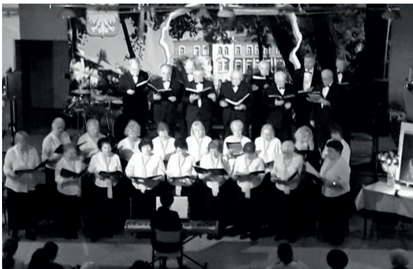
Występ chóru Albertinum.

z dumą prezentując przypięte biało-czerwone kotyliony. W tym dniu odbyła się akademie, podczas której dzieci recytowały wiersze patriotyczne, śpiewały piosenki oraz tańczyły poloneza. Pamiętając o żołnierzach walczących o wolność Polski, 21 listopada przedszkolaki odwiedziły cmentarz Rakowicki, gdzie zapaliły znicze na grobach poległych i zamordowanych w służbie Ojczyzny.