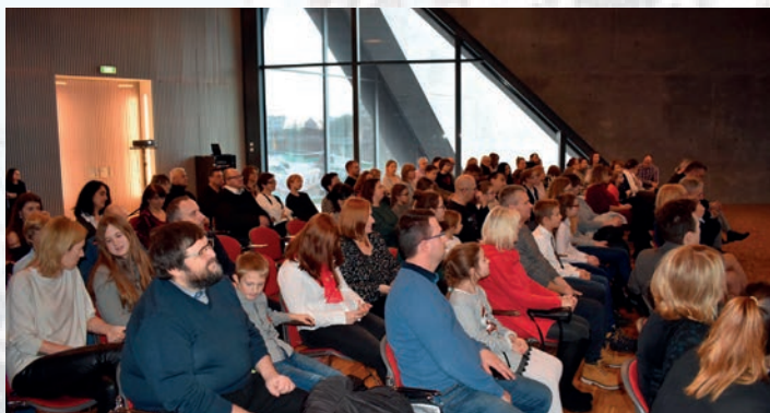
Zaproszeni laureaci i wyróżnieni, którzy...