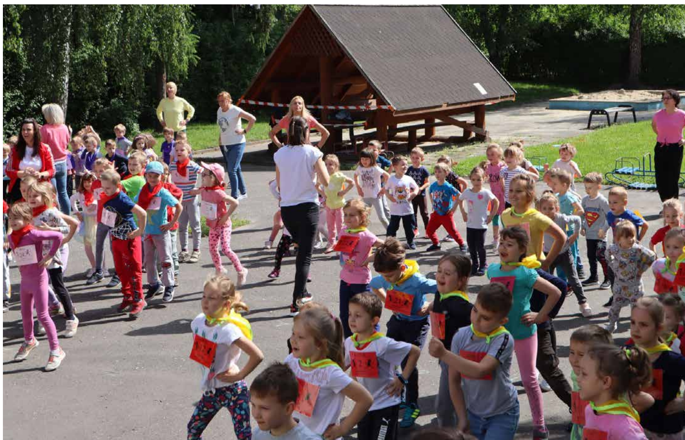
Olimpijskie zawody sportowe w Samorządowym Przedszkolu nr 178 przy ul. Sudolskiej 3.