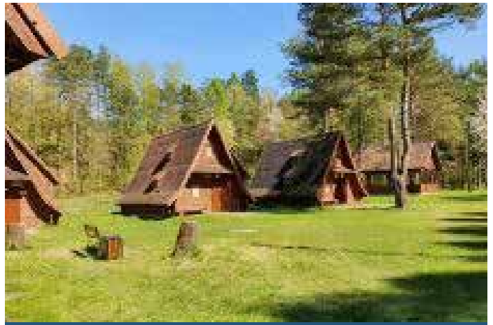
Ośrodek w Gołkowicach Górnych.

Program drugiej wycieczki nieznacznie różnił się od programu pierwszej. Przede wszystkim miał wówczas miejsce wyjazd do innego rezerwatu, również położonego