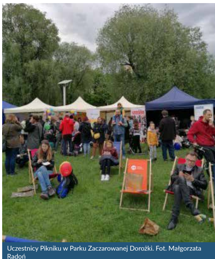
Uczestnicy Pikniku w Parku Zaczarowanej Dorożki.

Jedną z pierwszych imprez organizowanych w ramach tego Programu był piknik, zorganizowany przez Centrum Młodzieży im. dr. Henryka Jordana w Krakowie. Piknik odbył się 30 maja 2021 r. na terenie Dzielnicy III Prądnik Czerwony, a konkretniej w Parku Zaczarowanej Dorożki. Na jego bogaty i ciekawy program złożyły się m.in.: występy muzyczne i taneczne na scenie w wykonaniu Rewii Tanecznej Fuks z Centrum Kultury Calasanz Kraków-Wieczysta, nastolatków z Centrum Młodzieży, Centrum Aktywności Seniorów Renesans oraz zespołu Beauty Plate. Wokół sceny odbywały się warsztaty dla dzieci, prowadzone przez Centrum Młodzieży i świetlicę Wesołe Małolaty, gdzie zapraszano do nauczenia się: malowania i ozdabiania czapek, malowania twarzy, malowania na dużej powierzchni oraz malowania drobnych przedmiotów i wreszcie do pleneru malarskiego „W klimacie poezji”. Warsztaty ogrodnicze poprowadziła Fundacja HiTA wraz z seniorami