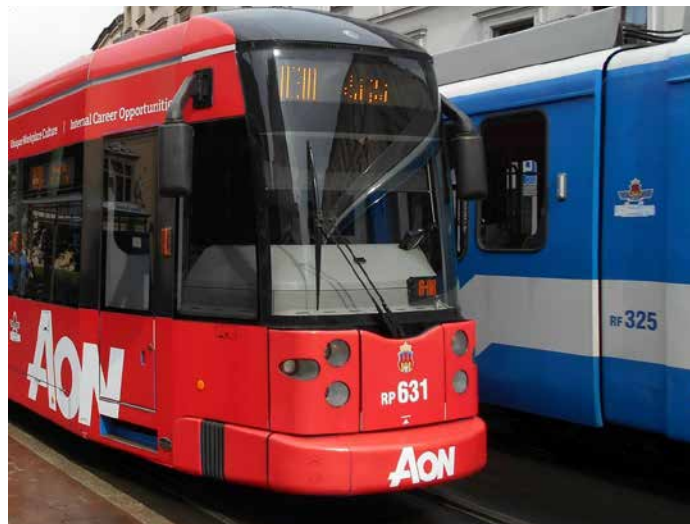
Rada Dzielnicy III zgłasza projektantom i władzom miasta szereg uwag, które otrzymujemy od mieszkańców.

Niezależnie od zakończonych konsultacji społecznych firma Gülermak Sp. z o.o. przygotowująca inwestycję wspólnie z Gminą Miejską Kraków zapewnia, że nadal trwają prace nad projektem, a Państwa uwagi i pytania są wciąż przyjmowane. Jeśli chcecie Państwa przekazać swoje sugestie lub uwagi do projektu można to zrobić mailowo na adres: info@tramwajdomistrzejowic.pl lub telefonicznie od poniedziałku do piątku w godz. 8-16 pod numerem: 722 22 00 88. Szczegóły dotyczące inwestycji, w tym projekty są dostępne na stronie: www.tramwajdomistrzejowic.pl .