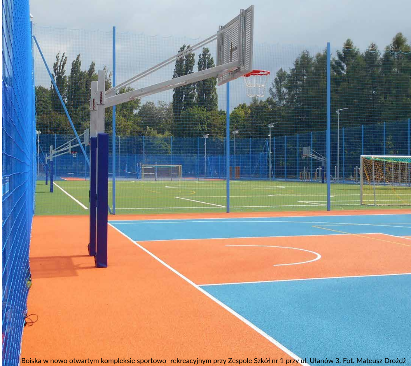
Boiska w nowo otwartym kompleksie sportowo-rekreacyjnym przy Zespole Szkół nr 1 przy ul. Ułanów 3.

Lotnicy z Rakowic doczekali się pomnika w Klimontowie pod Proszowicami str. 12-13