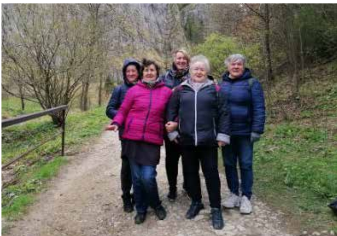
Uczestnicy wycieczki w wąwozie Homole.