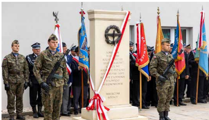
Uroczystość odsłonięcia pomnika, która odbyła się w Klimontowie w niedzielę 29 sierpnia 2021 r.

W niedzielę 29 sierpnia 2021 r. na placu przy remizie strażackiej w Klimontowie miała miejsce uroczystość odsłonięcia pomnika lotników 24. Eskadry Rozpoznawczej z Krakowa – Rakowic, którzy przez kilka ostatnich dni sierpnia stacjonowali na tamtejszym lotnisku polowym, a przez trzy pierwsze dni września 1939 r. wykonywali z lotniska w Klimontowie loty na rozpoznanie i bombardowanie oddziałów niemieckich. Historię samej inicjatywy oraz działań 24. Eskadry Rozpoznawczej z lotniska w Klimontowie zostały przedstawione w poprzednich numerach naszego „Biuletynu” (w numerze 3/2020 z listopada 2020 r. oraz w numerze 4/2020 z grudnia 2020 r. – oba numery dostępne są w wersji elektronicznej na stronie www.dzielnica3.krakow.pl ).