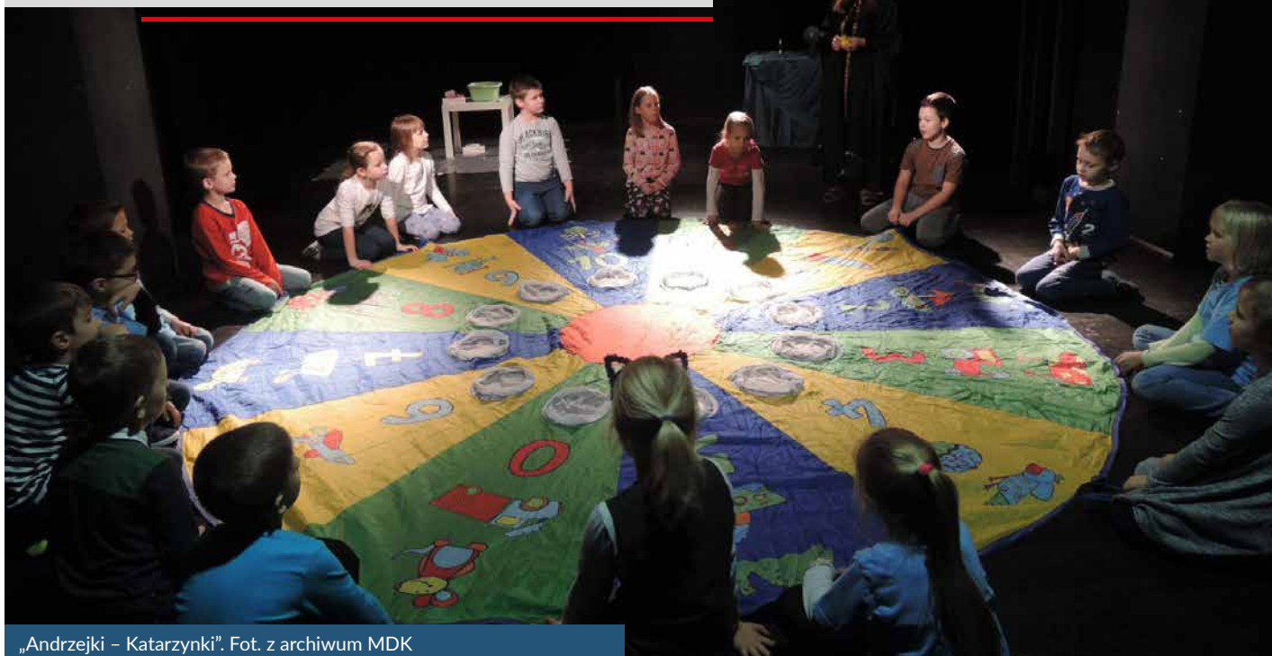
„Andrzejki – Katarzynki”.

Kilka lat temu został opracowany w Młodzieżowym Domu Kultury przy al. 29 Listopada 102 specjalny program spotkań dla grup szkolnych z klas I – III, który otrzymał tytuł „Tradycja z nutą i kolorem”. W ramach interaktywnych zajęć dzieci poznają wybrany temat historyczny w aspekcie muzycznym, literackim, plastycznym, jak również tanecznym. Wszystko to jest połączone zabawami oraz rywalizacjami, by omawiane zagadnienie łatwiej zapadało w pamięć, a światło, taniec, obraz i słowo rozbudzało wyobraźnię.