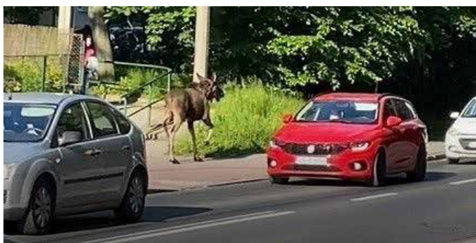
Łoś biegnący chodnikiem przy ul. Dobrego Pasterza od ronda Stanisława Barei w kierunku al. 29 Listopada. Fot. Kamila Ziarko

Mimo swego niegroźnego wyglądu, łosie potrafią być niebezpieczne dla ludzi. Ich zderzenie z samochodem może narobić poważnych szkód, ponieważ masa dorosłego osobnika może przekraczać nawet 700 kg. W przypadku spotkania łosia należy zrezygnować z prób przywoływania go lub nęcenia pokarmem. Najlepiej zostawić go w spokoju i pozwolić wrócić mu do jego naturalnego środowiska. W Polsce łosie znajdują się pod całoroczną ochroną gatunkową.