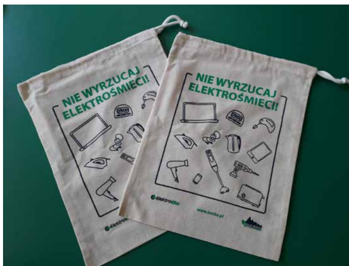
Worki wymieniane za elektrośmieci.