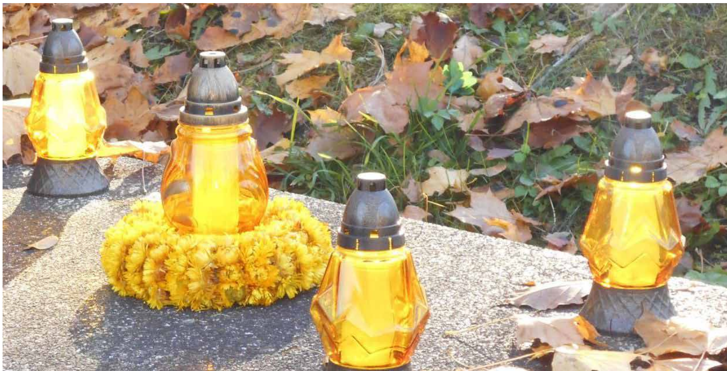
Pamiętając o naszych bliskich, pamiętajmy też o zasłużonych dla Dzielnicy, Krakowa, Polski, czy świata.