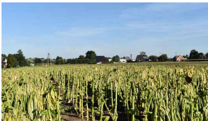
Obecne pola, niegdyś lotnisko polowe w Klimontowie.