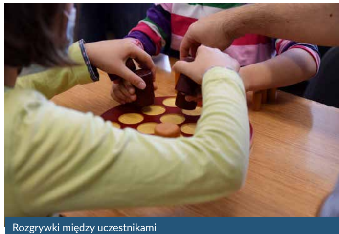
Rozgrywki między uczestnikami

Impreza ma na celu popularyzację wśród dzieci, młodzieży i dorosłych prostych gier logicznych, takich jak: „Quarto”, „Pentago”, „Speed Stacks”, „Pylos”, „Abalone”, „Dobble”, czy hokej stołowy. Równocześnie jest to impreza rodzinna zachęcająca rodziców do wspólnego spędzania czasu z pociechami, co ma szczególne znaczenie teraz – w czasach pandemii, kiedy życie zdominował komputer, telewizor oraz Internet. Podczas Festiwalu wiele osób po raz pierwszy zetknęło się z tego typu grami. Podkreślali ich wyjątkowy charakter, dzięki któremu oprócz wspaniałej rozrywki można było rozwijać koncentrację, umiejętność kojarzenia faktów, a także sprawność manualną i koordynację ruchową. Rozegrano konkurencje konkursowe w najpopularniejszych grach.