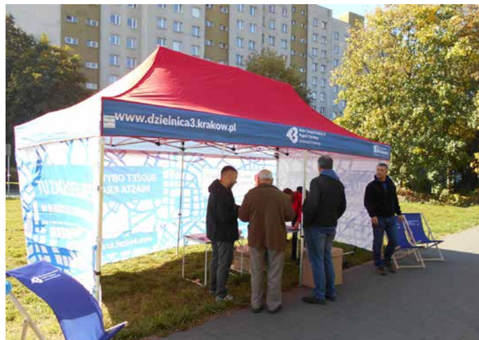
Nasz ruchomy punkt do głosowania przy placu zabaw przy ul. Ślicznej – Janusza Meissnera.

Do promocji idei budżetu obywatelskiego wykorzystaliśmy także V Wielki Charytatywny Piknik „Paczka dla Bohatera”, który odbył się na terenie parku Zaczarowanej Dorożki i który został objęty przez naszą Radę patronatem honorowym. Do naszej urny wpadały głosy nie tylko