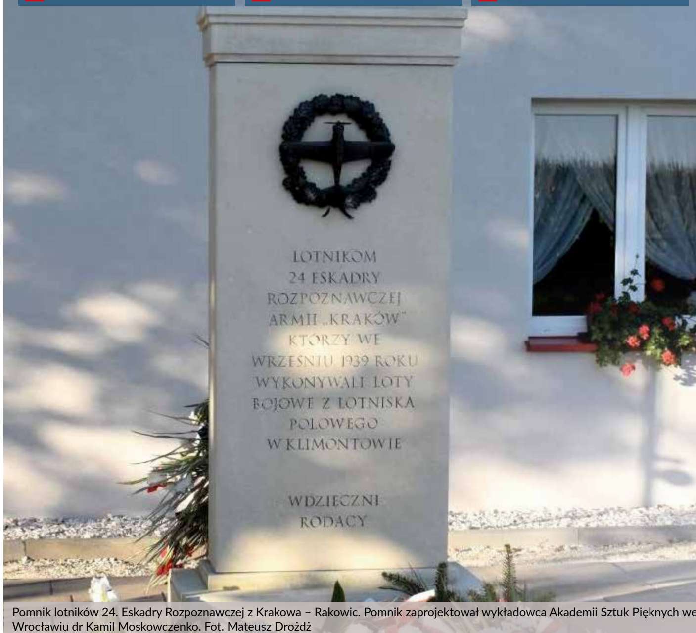
Pomnik lotników 24. Eskadry Rozpoznawczej z Krakowa – Rakowic. Pomnik zaprojektował wykładowca Akademii Sztuk Pięknych we Wrocławiu dr Kamil Moskowczenko.

Wspomnienie o tych, którzy odeszli w ostatnim roku str. 10-11