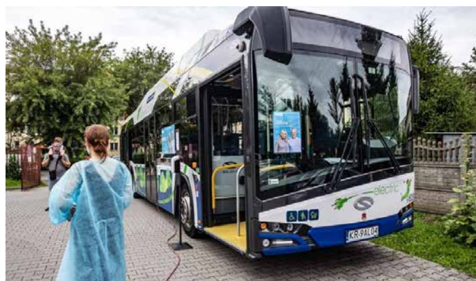
Mobilny punkt szczepień przy hali sportowej KS Prądniczanka.

Od stycznia Kraków podejmuje szereg działań, w tym promocyjnych, których celem jest rozpowszechnienie szczepień. Od początku realizacji Narodowego Programu Szczepień Kraków utrzymuje się na pierwszym miejscu wśród najlepiej wyszczepionych gmin w województwie małopolskim. Warto pamiętać, że epidemia wciąż trwa, a szczepienia są najskuteczniejszym sposobem ograniczenia ryzyka zachorowania i szansą na to, aby ograniczyć rozwój IV fali epidemii koronawirusa w Polsce. Szczepienia dają dodatkowo szansę na szybszy powrót do normalnego funkcjonowania społecznego i gospodarczego.